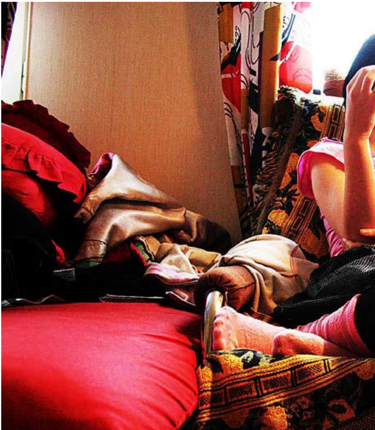
TELEXXX: Alt du har lurt på om telefonsex, men ikke hatt råd til å finne ut - eventuelt ikke har turt å spørre om - mener

► «NÅR JAG PROVJOBBADE innom hemtjänsten fick jag i två dagar gå med erfarna kvinnor som visste vad de gjorde. Som telefonhora blev jag istället fallskärmad ned på en öde ö med lätt packning bestående av en genomgång av de tekniska sidorna, samt åldrarna 15, 25 och 35 med tillhörande namn.»