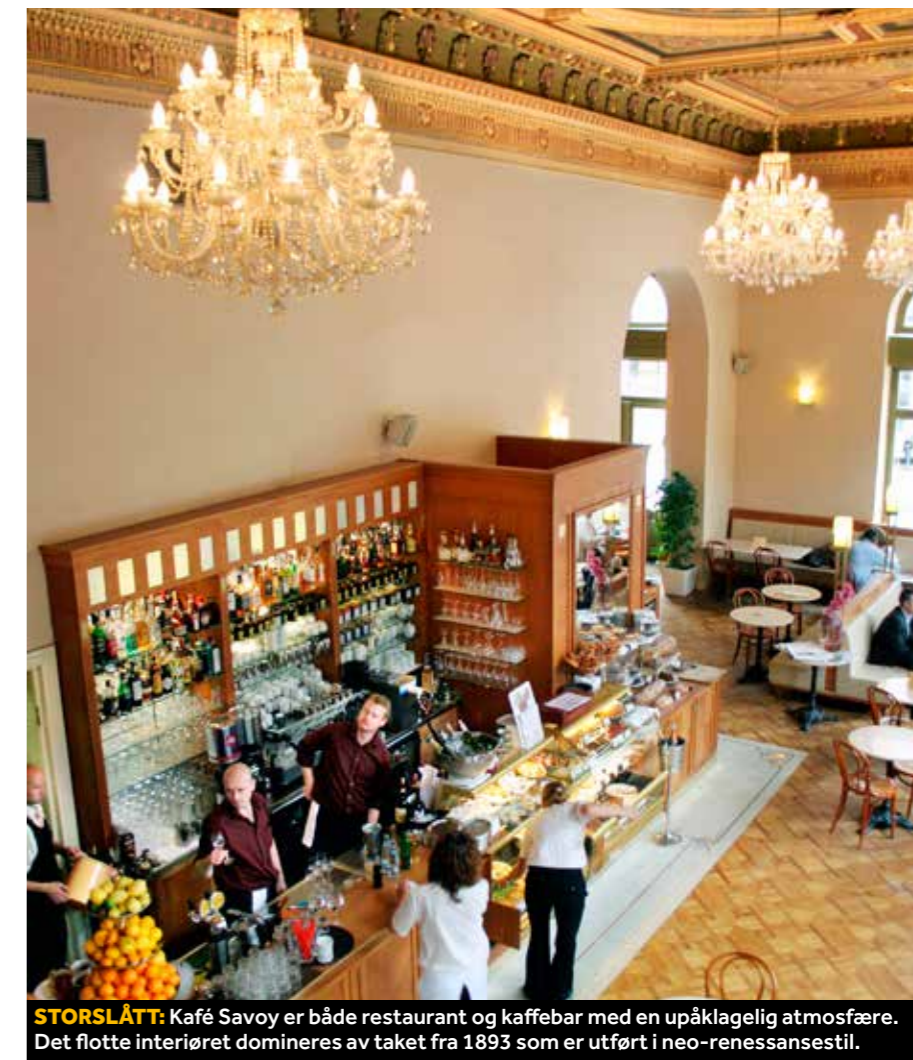
STORSLÅTT: Kafé Savoy er både restaurant og kaffebar med en upåklagelig atmosfære. Det flotte interiøret domineres av taket fra 1893 som er utført i neo-renessansestil.

Unngå turistfellene. Selv om Praha i utgangspunktet er en billig ferieby for nordmenn, bør man være obs på turistfellene. Turister på tur beveger seg gjerne langs en ganske smal løype i sentrum av byen, fra Kruttårnet, via torget i gamlebyen, over Karlsbrua og opp til slottet. Dette er vakre steder som alle besøkende vil ha glede av å oppleve, men kanskje ikke akkurat der du bør slå deg ned for en utepils eller et godt måltid mat. Prisene er gjerne mange ganger høyere enn om du beveger deg en gate unna. Sjekk menyen før du slår deg ned. En drink skal helst koste mellom ca. CZK 40 og 70, enten det er med eller uten alkohol. Oppsøk gjerne de klassiske Praha-kafeene, som Café Louvre i Národní 22 eller Café Slavia i begynnelsen av Národní-gaten, helt ved elven, den gamle stamkafeen til tidligere president Vaclav Havel. Om sommeren er terrassen på Café Adria i Národní 40/36 et flott sted å besøke. ☺