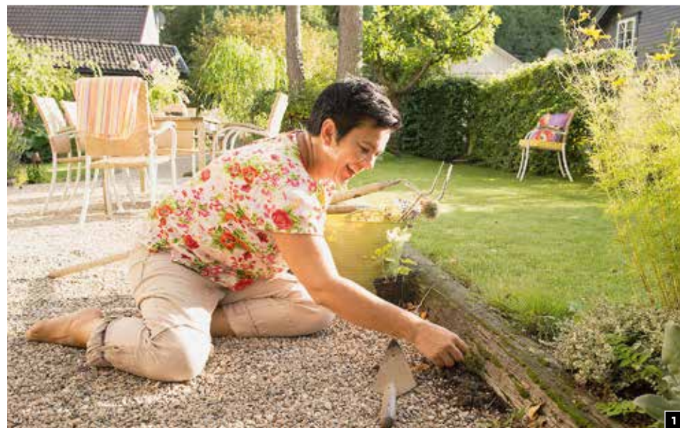
1 Annelis visjon er å luke bort stresset i hagen først. Det er mer plagsomt enn ugress. 2 Rustne kar og potter med fjellmarikåpe ( Alchemilla alpina ), vingefrøstjerne ( Thalictrum delavayi ) og flere sorter alunrot ( Heuchera ) 'Can Can', 'Caramel' og 'Palace Purple'. 3 Roser: 'Norwich Salmon', 'New Dawn' og 'Alchemist'. Stauder: Steppesalvie ( Salvia nemorosa ), gul lerkespore ( Pseudofumaria lutea ), fløyelsblad ( Lychnis coronaria ), orange anisop ( Agastache ) 'Tangerine Dream'. 4 Rose uten navn i tønna. Hvitblomstrede oregano, rosenrot ( Rhodiola rosea ) i krukke på stolen. I bakgrunnen: Svarthyll, syrin, og vingefrøstjerne. 5 Strandkatttehale ( Lythrum salicaria ) er en magnet for humlene. 6 Hengende hjertetre ( Cercidiphyllum japonicum f. pendulum ), bladlilje ( Hosta ) 'Big Daddy', hasselurt ( Asarum europaeum ), gullydne ( Azorella trifurcata ) 'Elliot's Var', silkekinagras ( Miscanthus sinensis ) og fotadiantum ( Adiantum pedatum ) 'Venushår'. 7 Frøplanter av vingefrøstjerne i vakre leirpotter. 8 Rosen 'Peace' sammen med fløyelsblad ( Lychnis coronaria ).

Mens vi vandrer rundt i hagen, forteller hun om