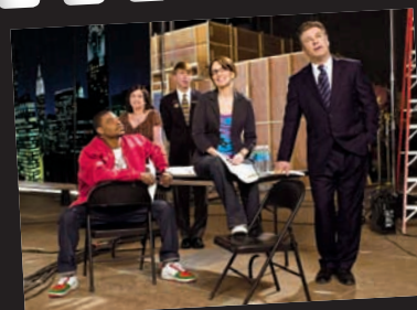
30 Rock – med Tina Fey i rollen som Liz Lemon og Alec Baldwin (til høyre) som Jack.

Hun mener seriene knytter bånd mellom folk. Dvd-boksene har fått den samme funksjonen som bøker alltid har hatt. Hvilke bokser vi putter i hyllen definerer hvem vi er, men minst like viktig er det hvilke serier som ikke får plass der.