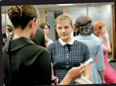
Mad Men – reklamebransjen på 60-tallet, da pene piker var pene piker.