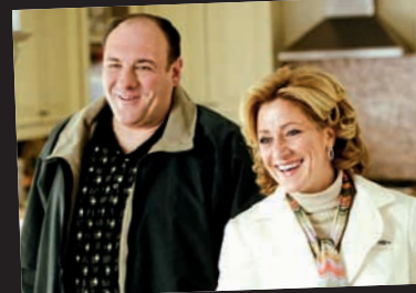
Sopranos – en av de første seriene man kunne bli hekta på, og si det høyt.