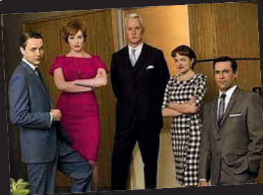
Mad Men er basert på historien om reklamefirmaet Leo Burnett.