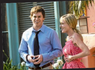
Seriemorder i et fredelig øyeblikk – Dexter i Michael C. Halls skikkelse.