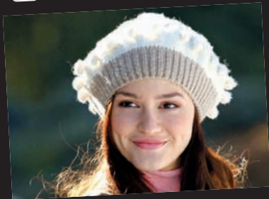
Gossip Girl: Leighton Meester som Blair.