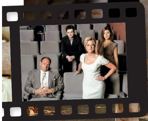
Sopranos ga oss menneskene bak mafiaen. Det gikk faktisk an.