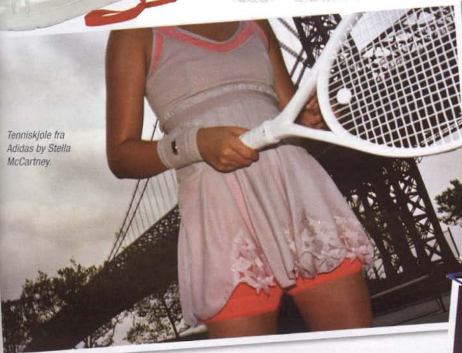
Tenniskjole fra Adidas by Stella McCartney.