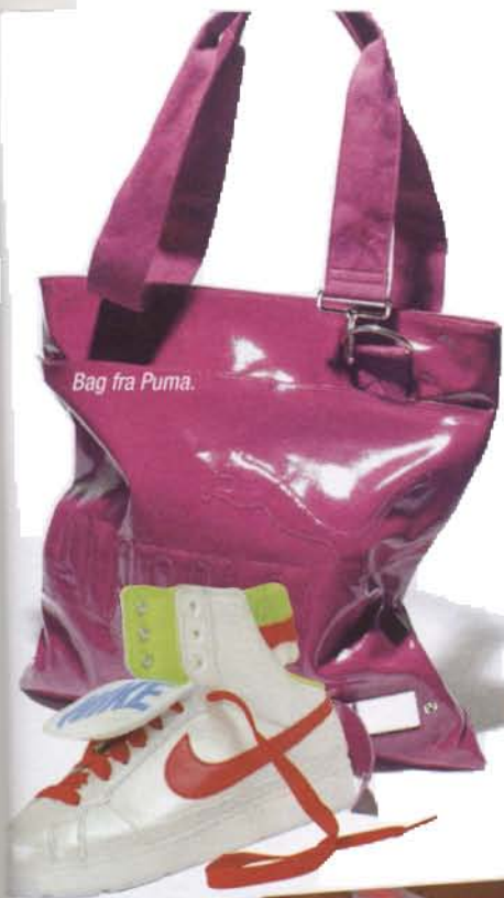
Bag fra Puma.