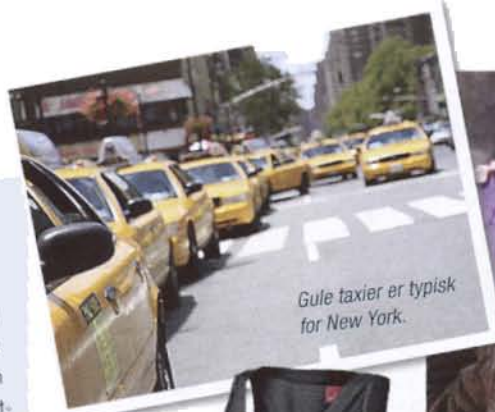
Gule taxier er typisk for New York.

Er du opptatt av hvordan puppene dine tar seg ut når du trener, bør du stikke innom Victorias Secret . Der får du treningsbh-er med padding, som både skjuler brystvortene og får puppene til å se litt større ut.