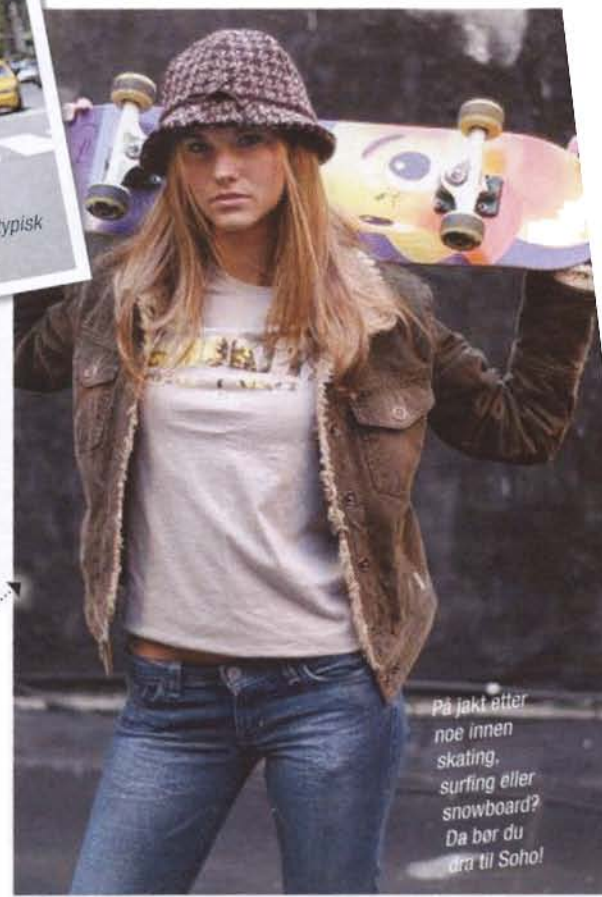
På jakt etter noe innen skating, surfing eller snowboard? Da bør du dra til Soho!