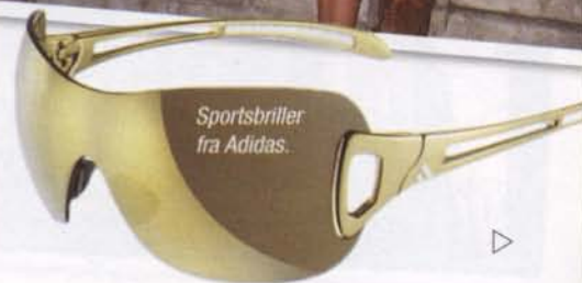
Sportsbriller fra Adidas.