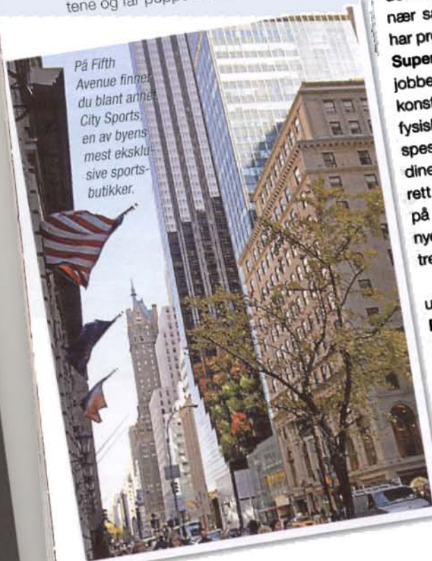
På Fifth Avenue finner du blant annet City Sports , en av byens mest eksklusive sportsbutikker.

Golfentusiaster finner sin spesialbutikk i Midtown, ikke langt fra Fifth Avenue. Hos Goldsmith venter innendørsbaner og simulatorer. Du kan teste ut køller fra TaylorMade , Ping og Callaway mens et kamera filmer og analyserer stillingen din og slag hastigheten.