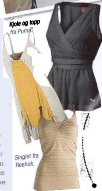
Singlet fra Reebok.