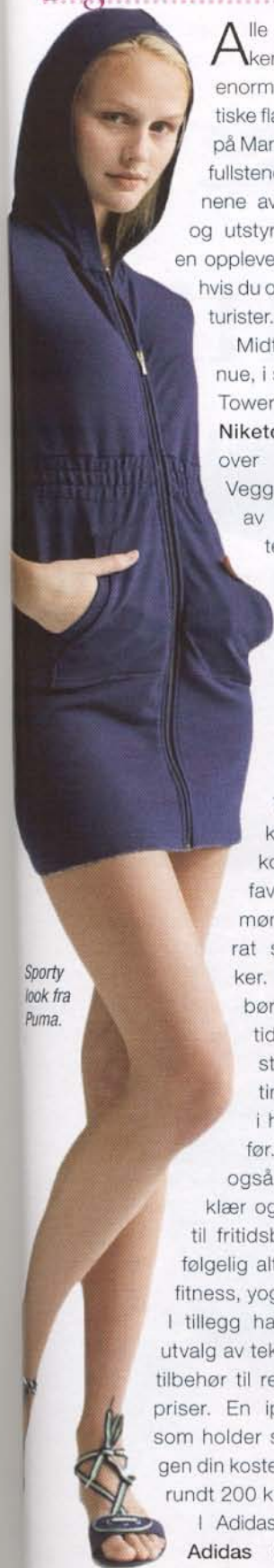
Sporty look fra Puma.

Alle de største merkene har sine enorme, karakteristiske flaggskipbutikker på Manhattan, med de fullstendige kolleksjonene av klær, tilbehør og utstyr. Butikkene er en opplevelse i seg selv – hvis du orker hordene av turister.