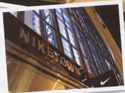
I Trump Tower finner du Niketown, spredt over fem etasjer.

et stykke lengre unna resten av sportsbutikkene. □