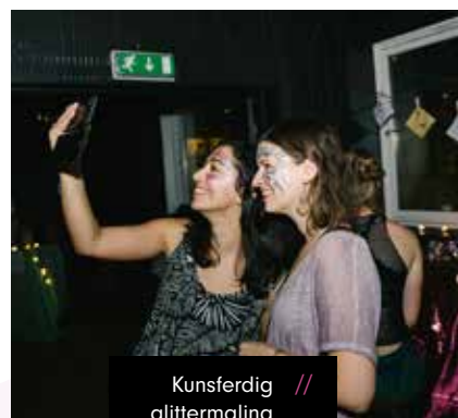
Kunsterdig // glittermaling