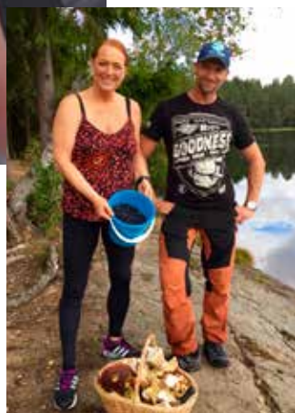
FELLES INTERESSER: Vi trives best ut på tur, her har vi vært på blåbær- og sopptur i marka.