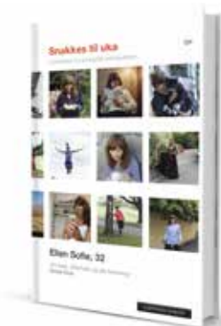
«Snakkes til uka – feltnotater fra en digital datingverden». Cappelen Damm, 379 kr.

«Fordelen med app- og nettdating er at det er en super arena å møte folk på»