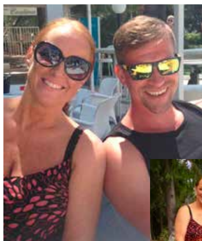
NYFORELSKET: Vår fjerde date var under en miniferie til Mallorca. Der ble vi kjærester.