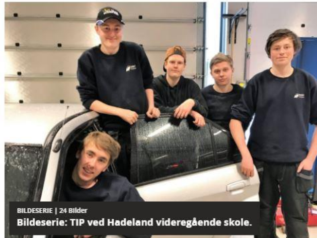
BILDESERIE | 24 Bilder Bildeserie: TIP ved Hadeland videregående skole.

- Gamle fordommer er den største trusselen mot TIP. Vi ønsker derfor å spre kunnskap om linja, slik at den blir en positiv snakkes rundt middagsbordet. Faget er også meget allsidig og hele tiden i endring, ikke minst på grunn av teknologien. Dette stiller variert krav til elevene og vi trenger alle, sier fagskolelæreren.