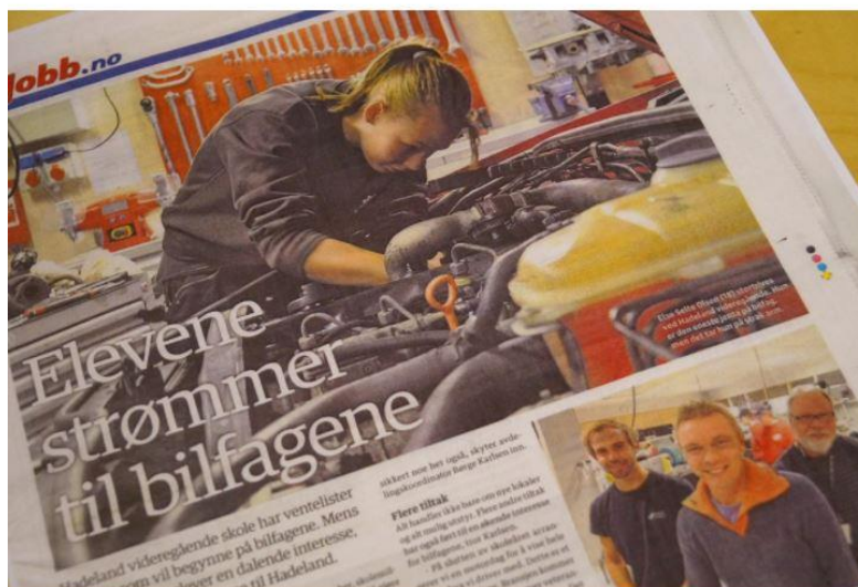
BLIR LAGT MERKE TIL: Hadeland videregående skole har fått mye spalteplass i fagpressen på grunn av sine gode resultater, blant annet innen bilfag.

De gode resultatene fra Hadeland er bredt omtalt i fagpressen. I tillegg er de lagt merke til i Oppland fylke. De er også presentert fra Stortingets talerstol som eksempler på godt og innovativt utdanningsarbeid.