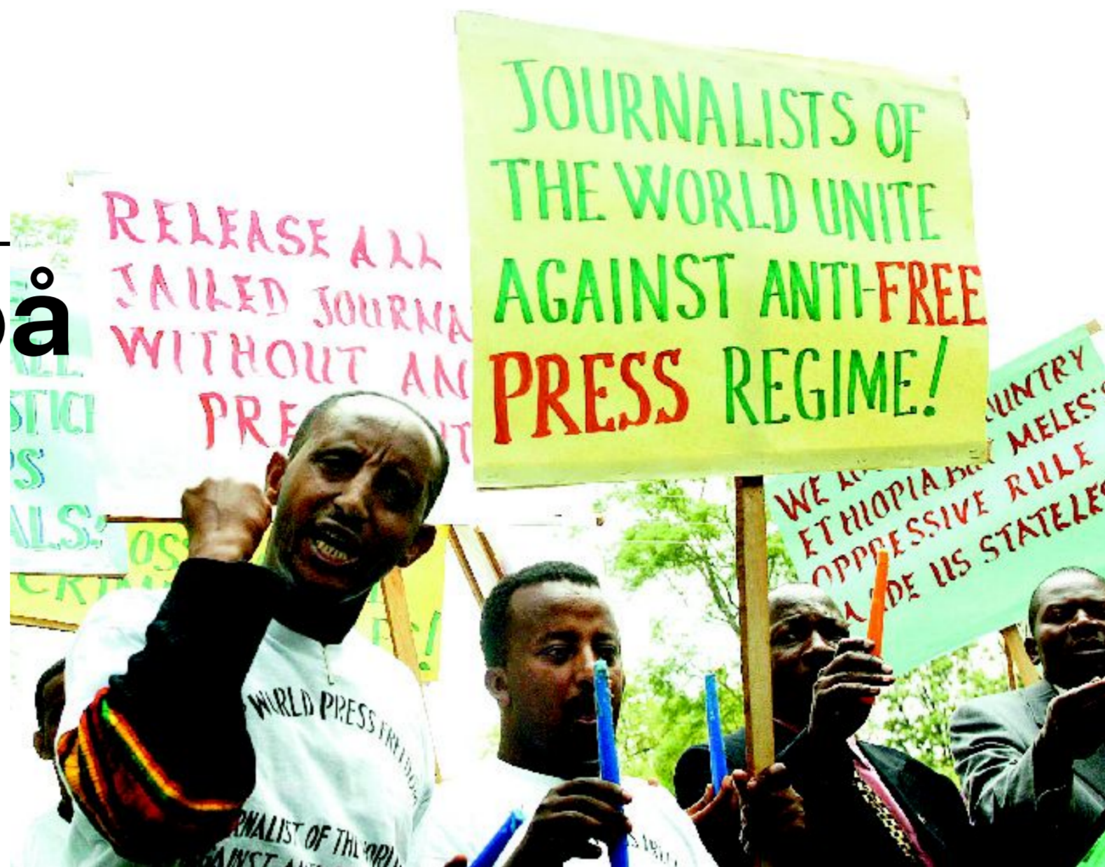
DEMONSTRERER: Etiopiske journalister krever løslatelse av fengslede kolleger utenfor den etiopiske ambassaden i Nairobi 2. mai i år.