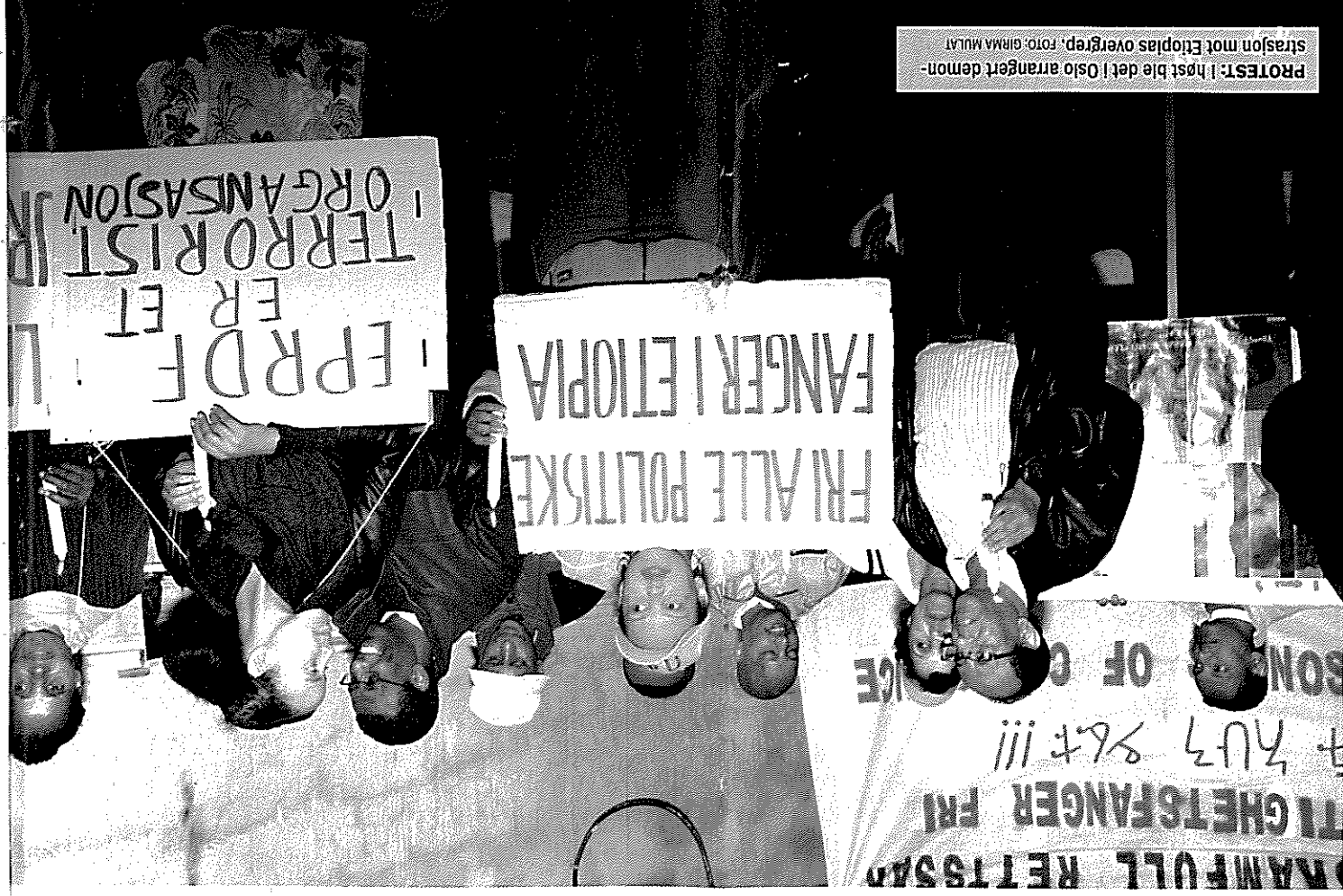
PROTEST: I høst ble det i Oslo arrangert demonstrasjon mot Etiopias overgrep.

AV GIRMA ENDRIAS MULAT OG TORBJØRN TUMYR NILSEN