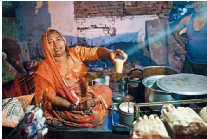
Chai Inne i slummen er det også små teutsalg, og her får man seg en kopp chai for noen øre.