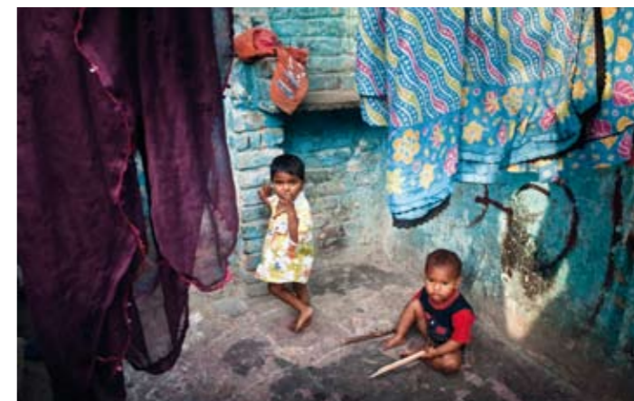
Ikke kravstore Under klestørken leker man med det man har. Rundt 80 prosent av barna i slummen er feilernærte.