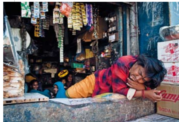
Siesta Butikk-innehaver Mhavar sover en liten for-middagslur.