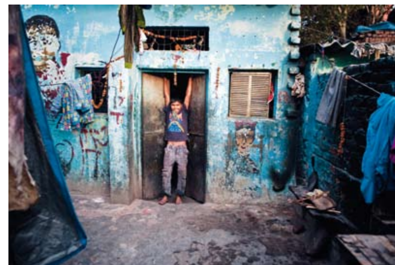
Akrobat Himansho Vine i døren til sitt hjem. Utenfor er det en liten gårdsplass der maten lages og klær henges opp.