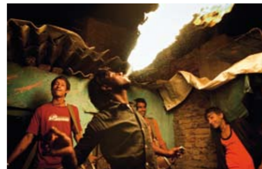
Leker med ilden Når ungdommene samles på kveldene blir det fort dans og flammeslukning, som også er en inntektskilde for artistene.

«Det er rundt 2000 familier her, med fire-fem barn i hver, så omtrent 10 000 mennesker har tilhold i området. Alle driver med akrobatikk, spiller munnspill, trommer, dukketeater, er dyretrenere eller gjøglere. Vi kommer opprinnelig fra Rajasthan i nord, men det er lite jobb der, så det er bedre her», forteller han.