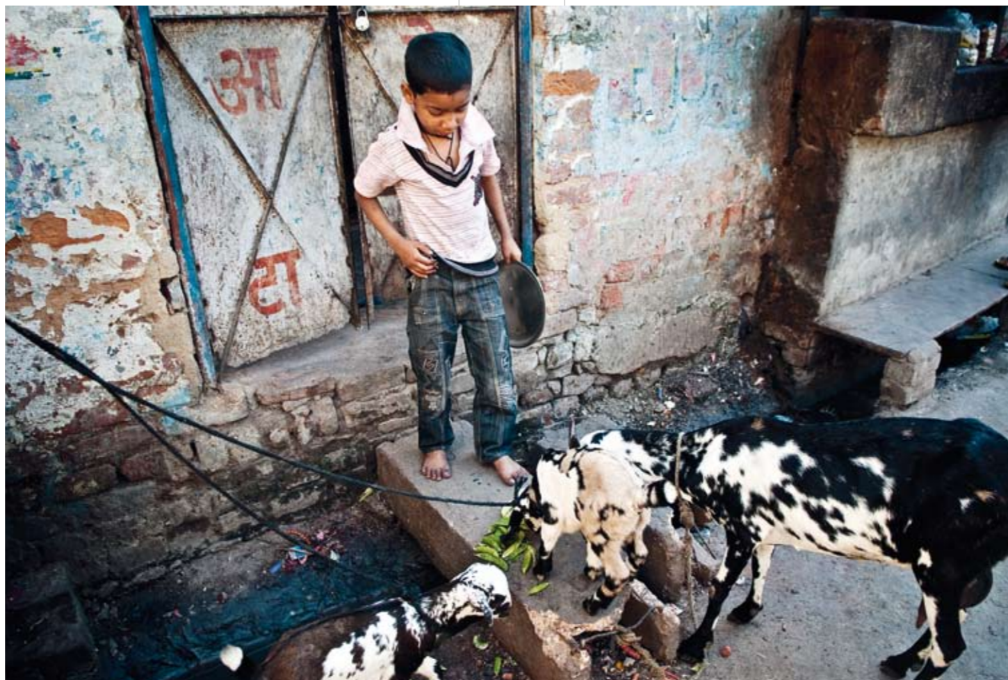
Geiter Også dyrene har sin plass i slummen, som forøvrig Salman Rushdie skrev om i romanen «Midnight's Children».