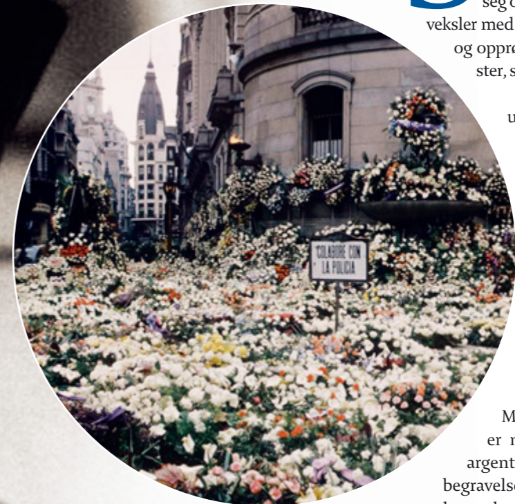
Blomsterhavet i Buenos Aires etter Eva Peróns død i 1952.

Mange utenfor Latin-Amerika forbinder nok Eva Perón først og fremst med