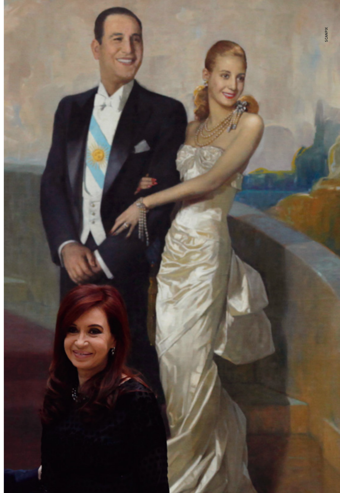
Argentinas nylig gjenvalgte president, Cristina Fernández de Kirchner, har ingenting imot å bli assosiert med ekspresident Juan Perón og hans legendariske Eva.

“Min mest vidunderlige dag var da mitt og Peróns liv krysset hverandre,” står det med store bokstaver på veggen i museet. Frasen er hentet fra Evitas selvbiografi La razon de mi vida (“Mitt livs mening”). Den Askepott-lignende historien gjør at flere av museets besøkende blir blanke i øynene, men det ligger en tragisk hendelse bak Evitas “mest vidunderlige dag”.