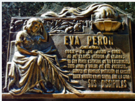
Eva Peróns grav er en av Buenos Aires' største turistattraksjoner.

15. januar 1944 ble provinsen San Juan ved foten av Andesfjellene rammet av et jordskjelv, og rundt 10 000 mennesker omkom. Og det var under en veldedighetskonsert til inntekt for ofrene at Evita og Perón møttes. Den 24 år gamle skuespilleren skal ha gjort sitt for å fange den 49 år gamle generalens oppmerksomhet. Ryktene sier at de forlot lokalet arm i arm. Det som er sikkert, er at ett år senere giftet de seg. Fra 1946 skulle den tidligere skuespillerens “scene” bli en balkong i president-