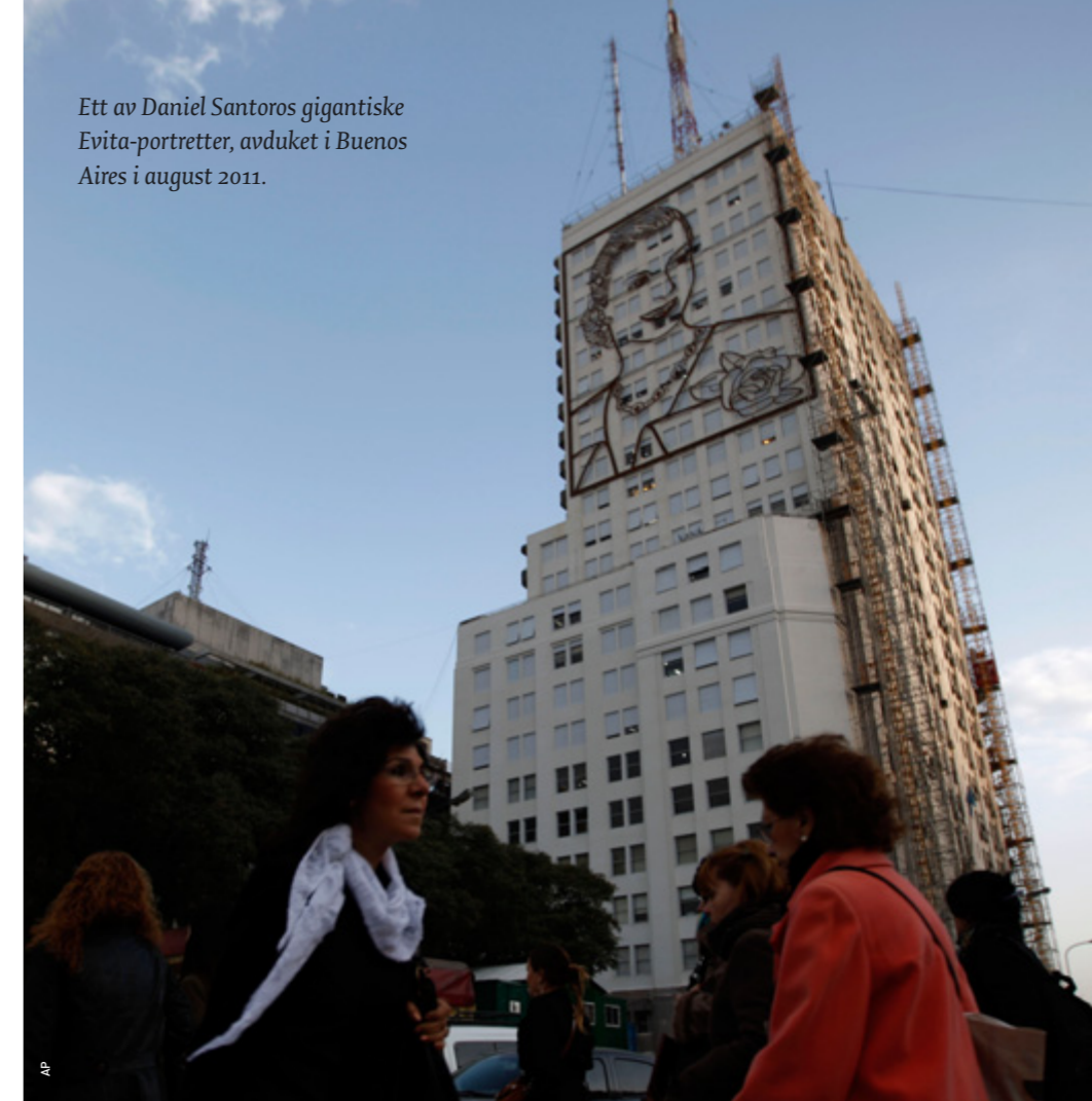
Ett av Daniel Santoros gigantiske Evita-portretter, avduket i Buenos Aires i august 2011.