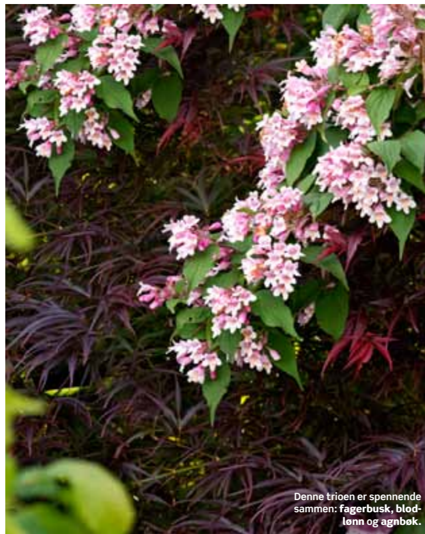
Denne trioen er spennende sammen: fagerbusk, blodlønn og agnbøk.