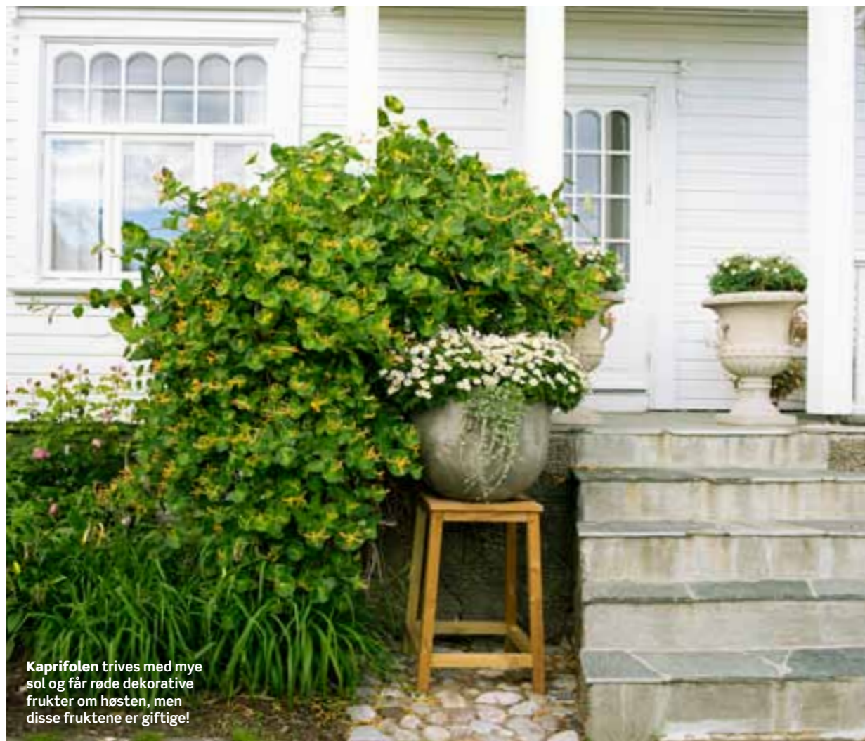
Kaprifølen trives med mye sol og får røde dekorative frukter om høsten, men disse fruktene er giftige!