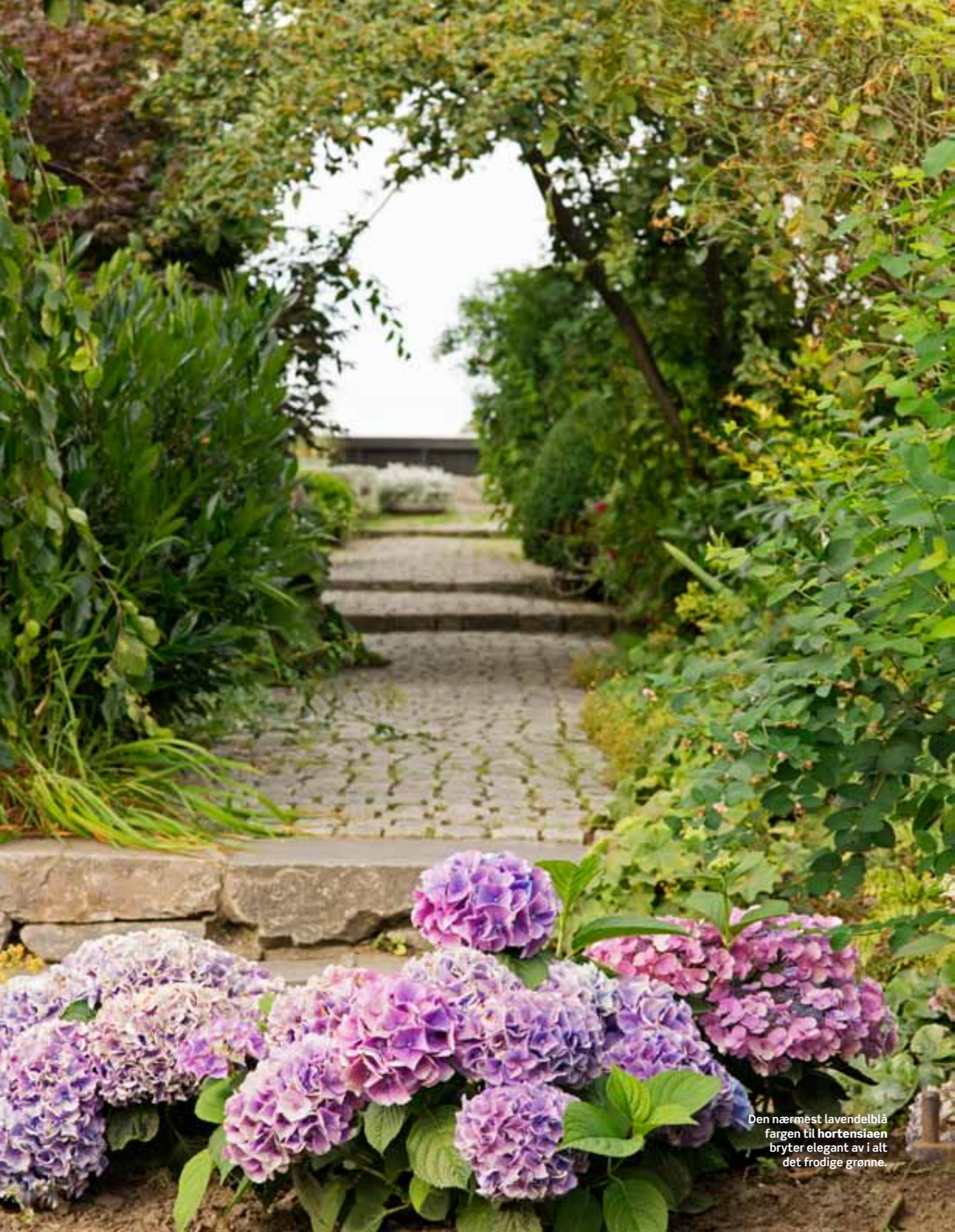
Den nærmest lavendelblå fargen til hortensiaen bryter elegant av i alt det frodige grønne.