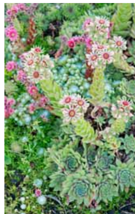
Takløk skal ha skrin jord og trenger verken gjødsel eller vanning.

Kan ikke leve uten: Alle frukt- og bærbuskene.