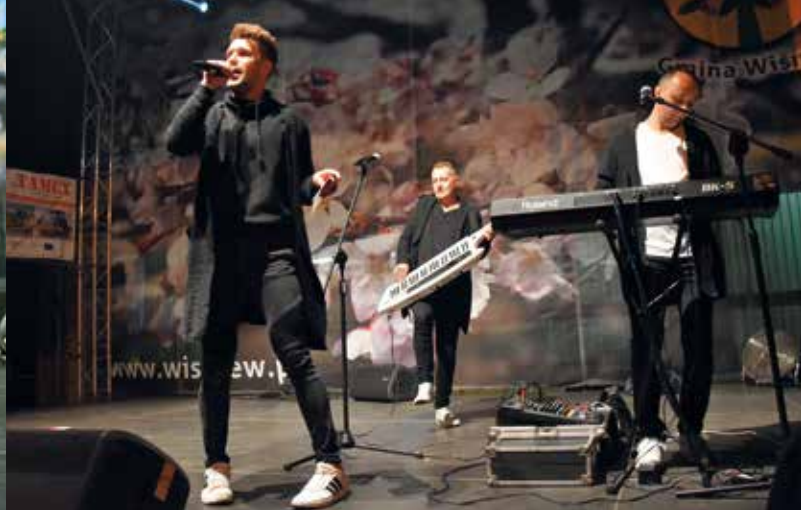
Zespół DEFIS.