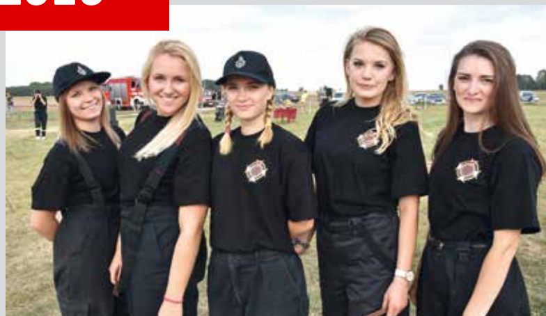
Kobieca drużyna pożarnicza z OSP Wiśniew.

Serdecznie gratulujemy zwycięzcom i dziękujemy sponsorowi tegorocznych Zawodów Sportowo-Pożarniczych OSP, którym był: ZUO Siedlce .