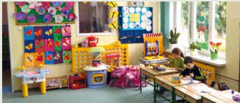
Oddział przedszkolny w ZO Śmiary.

Przebudowa budynku szkolnego na przedszkole planowana jest również w Zespole Oświatowym w Śmiarach. Obecnie jest opracowywana dokumentacja projektowa. Pomieszczenia planowane do wykorzystania na potrzeby przedszkola dwuoddziałowego o łącznej powierzchni użytkowej ok 180 m 2 znajdują się na parterze i w podpiwniczeniu budynku. Prace projektowe zakończą się w listopadzie br.