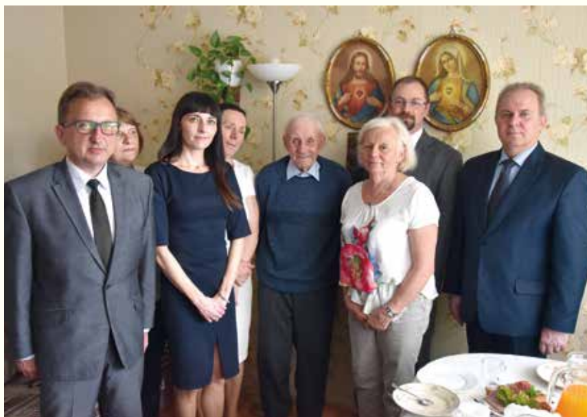
Pamiątkowa fotografia.