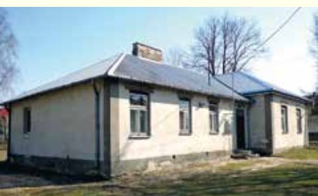
Świetlica w Daćbogach.

Wkrótce zostanie również podpisana umowa na wykonanie „Przebudowy świetlicy wiejskiej w Daćbogach”. Trwają prace związane z wyborem wykonawcy w toku procedury przetargowej. Wg warunków przetargu roboty związane z przebudową zakończą się we wrześniu 2017 r. Kubatura budynku po przebudowie będzie wynosić 1.564 m 3 , obiekt będzie dostosowany do potrzeb osób niepełnosprawnych. Oprócz przebudowy, rozbudowy i nadbudowy budynku zostanie wykonany zbiornik na nieczystości ciekłe, zjazd z drogi powiatowej, ciągi piesze i utwardzone miejsca parkingowe. - Tę inwestycję rada wpisała do Wieloletniej Prognozy Finansowej i zwiększyła pulę środków o 200 tysięcy złotych. Do końca grudnia na wykonanie robót zamierzamy wydać około 200 tysięcy złotych - zapowiada Józef Romańczuk. Szacowany koszt inwestycji wyniesie blisko 900 tys. zł.