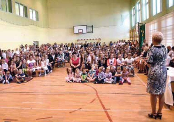
Początek roku szkolnego w ZO Wiśniew.