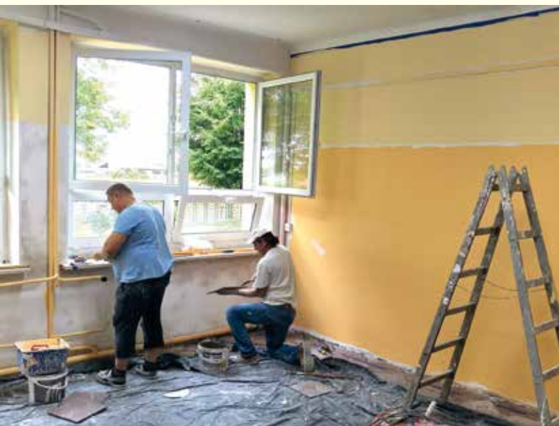
Prace remontowe w ZO Radomyśl.

W 2017 roku w obiekcie planowane jest również wykonanie II etapu zadania tj. przebudowę budynku szkolnego na przedszkole.