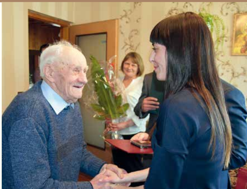
Życzenia dla Jubilata.