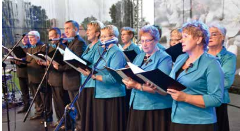
Zespół Wokalny RADOŚĆ z Radomyśli.

promocja gminy Wiśniew w regionie poprzez rozpowszechnianie najlepszych potraw, produktów i nalewek - obowiązkowo z wiśni, które co roku aspirują do miana nie tylko lokalnych specjałów. Podczas festiwalu nagradzani są autorzy najsmaczniejszych potraw - wszyscy zaproszeni goście mają możliwość ich degustacji. Prezentowany jest także dorobek kulturalny naszego regionu, co roku na scenie podziwiać możemy znakomite zespoły. Tradycją stało się chyba także, że corocznie towarzyszą nam opady deszczu.