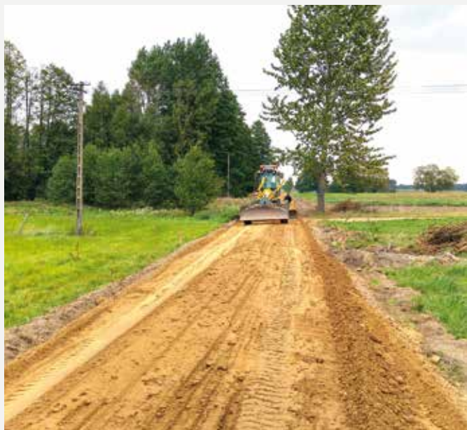
Remont drogi do pól w łupinach.

Trwają prace budowlane związane z „ Przebudową drogi dojazdowej do pól i łąk w Łupinach ”. Przebudowa będzie obejmowała wykonanie nawierzchni żwirowej na pięciu odcinkach drogi o łącznej długości 3.790 m i szerokości pasa 6 i 9 m. Obecnie na wspomnianych odcinkach w większości występuje nawierzchnia gruntowa i żwirowa, jednak ze względu na zły stan techniczny i w trosce o bezpieczeństwo mieszkańców drogę należy poddać przebudowie. Na początku września została podpisana umowa na wykonanie zadania, a także nastąpiło przekazanie placu budowy Wykonawcy, którym jest Firma Handlowo-Usługowo „Tamex” ze Szczygł Górnich. Zgodnie z podpisaną umową roboty budowlane powinny być zakończone do 31 października br. Szacowany koszt inwestycji to blisko 142 tys. zł, finansowana ona będzie z budżetu gminy oraz z funduszu sołeckiego.