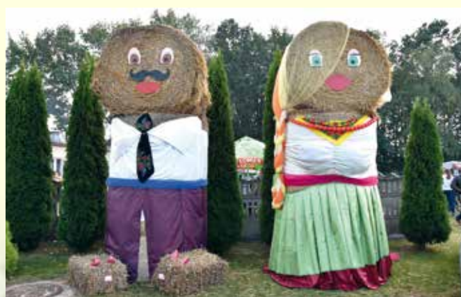
Dożynkowe dekoracje. Fot. UG