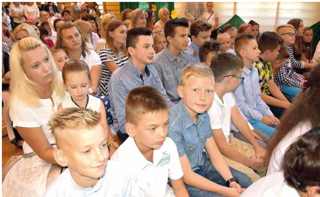
Uczniowie ZO Wiśniew.