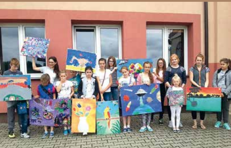
Uczestnicy warsztatów.

W dniach 12 – 15 lipca 2016 r. w Gminnym Ośrodku Pielęgnacji Tradycji Kulinarynych w Wólce Wiśniewskiej odbyły się warsztaty artystyczne dla dzieci i młodzieży z terenu naszej gminy.