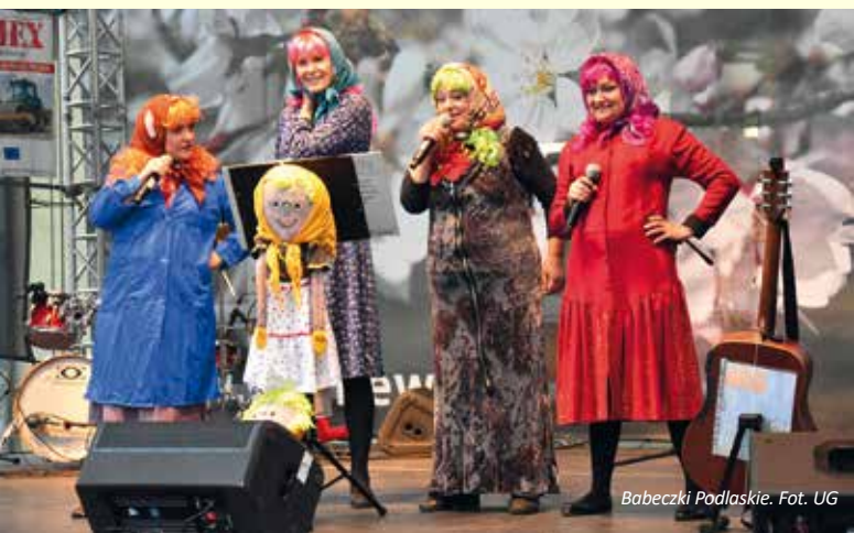
Babeczki Podlaskie.