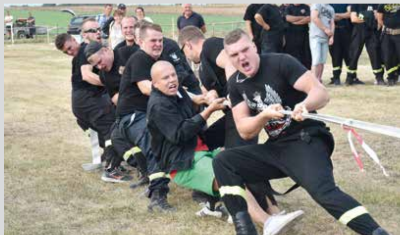
Widowiskowe zawody w przeciąganiu węża.