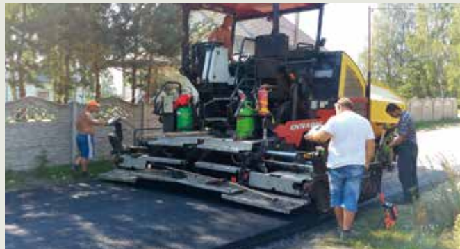
Remont drogi w Zabłociu.

We wrześniu zakończono również kolejną inwestycję drogową tj. „ Przebudowę drogi dojazdowej do pól w miejscowości Zabłocie ”. Roboty budowlane trwały od czerwca do września, a ich Wykonawcą było Przedsiębiorstwo Robót Drogowo-Mostowych MIKST z Węgrowa. Zadanie obejmowało wykonanie nawierzchni asfaltowej na odcinku o długości ok. 600 m i szerokości jezdni 4,5 m oraz wykonanie poboczy z kruszywa łamanego. Koszt inwestycji to ok. 139 tys. zł, w całości sfinansowana została z budżetu gminy.