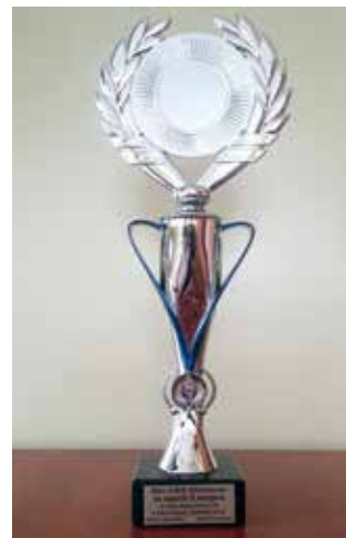
Puchar. Fot. UG