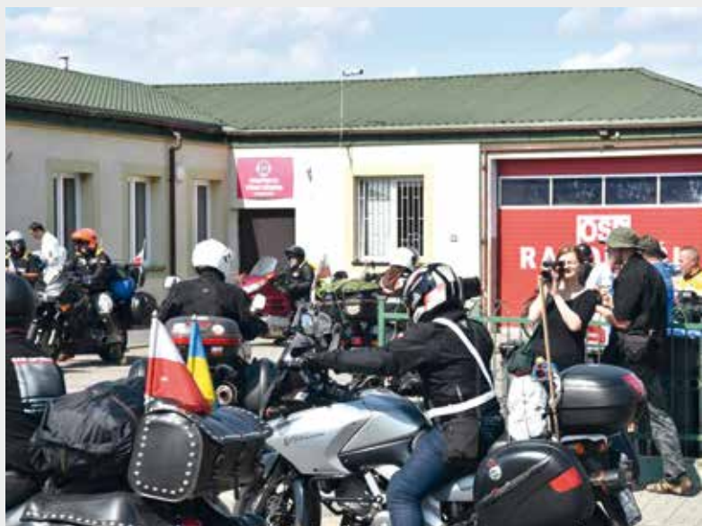
Postój w Radomyśli.