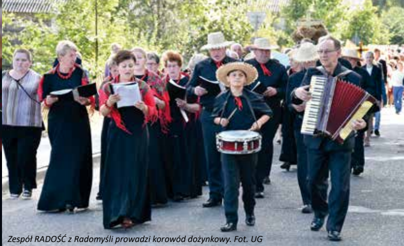
Zespół RADOŚĆ z Radomyśli prowadzi korowód dożynkowy.