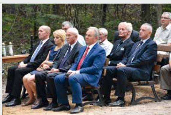
Zaproszeni goście.