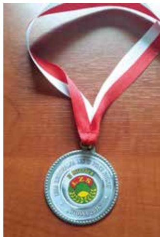
Medal za II miejsce.