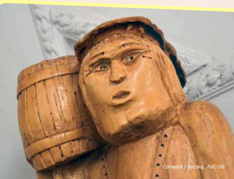
Człowiek z beczką.

KW: - Dotychczas nie uczestniczyłem w żadnych wystawach. Kilka lat temu prezentowałem część swoich prac podczas turnieju gmin w Warszawie, w którym brał udział nasz lokalny samorząd. Wiele moich prac podarowałem rodzinie, znajomym. W kościele parafialnym w Wiśniewie jest moja praca przedstawiająca postać Chrystusa Frasobliwego.