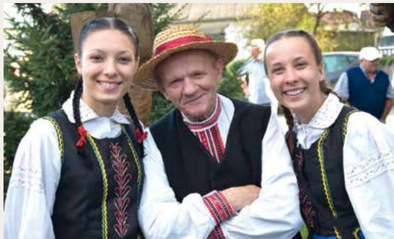
Kapela Zdzisława Marczyka.