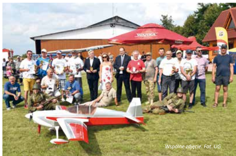
Wspólne zdjęcie.