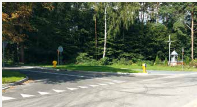
Droga w Lipniaku. Fot. UG

Pod koniec sierpnia zakończono prace związane z „ Przebudową drogi na terenie miejscowości Lipniak, Stok Wiśniewski (od wsi Lipniak do drogi powiatowej przez miejscowość Lipniak) ”. Roboty budowlane wykonywało Przedsiębiorstwo Robót Drogowych Regionalne Drogi Podlaskie z Siedlec. Zadanie obejmowało wykonanie nawierzchni bitumicznej na odcinku o długości ok. 531 m i szerokości jezdni 5 i 5,5 m oraz wykonanie poboczy i nawierzchni z betonowej kostki brukowej okalającej wyspy kierujące służące do zawracania autobusu. Koszt inwestycji to ok. 338 tys. zł, w całości sfinansowana została z budżetu gminy.