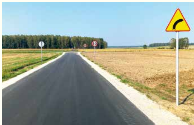
Droga Pluty - Grzędówka.

Zakończono prace związane z „ Przebudową drogi gminnej w Plutach w kierunku Grzędówki ”. Odbiór nastąpił 7 września br, natomiast uroczyste otwarcie odbyło się 21 września. Przedmiotowa przebudowa obejmuje ułożenie betonu asfaltowego na odcinku drogi o długości ok. 1940 m oraz szerokości jezdni 5,0 m. W ramach zadania wykonano również remont dwóch przepustów drogowych oraz zjazdów na drogi wewnętrzne i pobocza z kruszywa łamanego. Łączny koszt inwestycji wyniósł blisko 587 tys. zł. Wykonawcą zadania było Przedsiębiorstwo Robót Drogowych „Regionalne Drogi Podlaskie” z Siedlec.