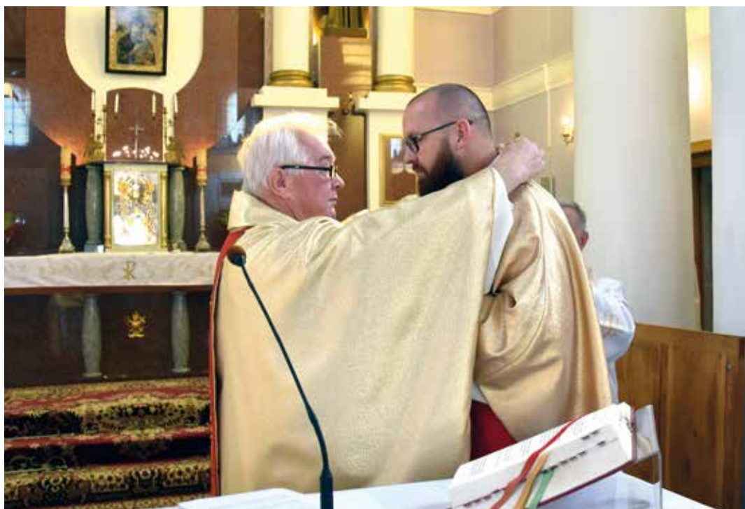
Symboliczne przekazanie Krzyża Misyjnego.