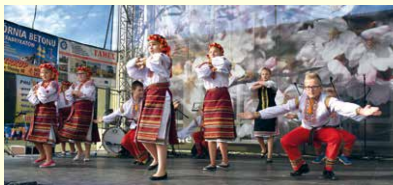
ZLPiT Wiśniewiaczy.