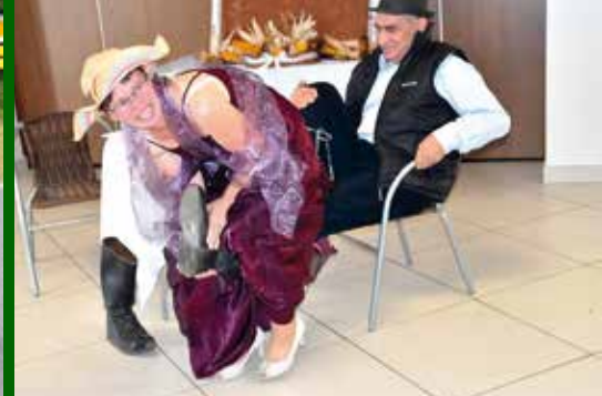
Skecz w wykonaniu Państwa Krasuskich.