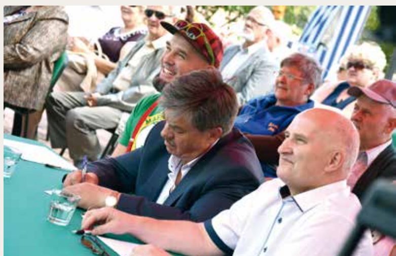
Festiwalowe jury.

Festiwalowym prezentacjom towarzyszyły stoiska handlowe i gastronomiczne z łakociami dla najmłodszych.