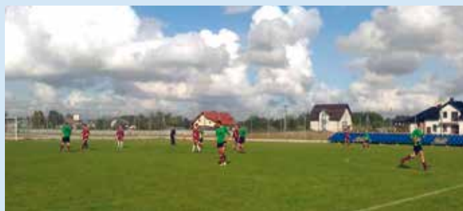
LZS Koszewnica - UKS Wiśniew.

Następnie 18 września UKS Wiśniew udał się na mecz do Nowych Osin, na mecz z Herkulesem Nowe Osiny, gdzie odniósł w pełni zasłużone zwycięstwo 4:2.