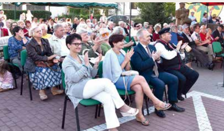
Zgromadzona publiczność.