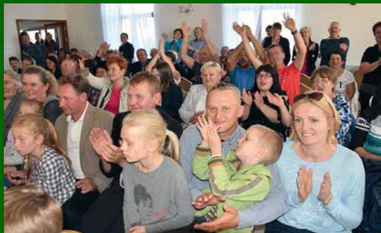
Zgromadzona publiczność.