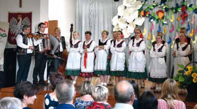
Słowacki Zespół Maguranka.