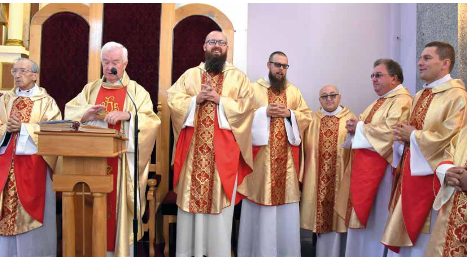
Ks. Tomasz z zaproszonymi kapłanami.

Ks. TG: – Z powołaniem nigdy nie ma tak, że ty masz powołanie i powinieś tam iść. To pragnienie od zawsze było u mnie ukryte głęboko w sercu. Pociągały mnie spotkania z misjonarzami, wyjazdy do innych krajów, pojawiła się chęć pracy w kraju obcym, dalekim. Pomimo, że jest inna kultura, inny język, pomimo że jest to bardzo wymagające, bo trzeba się nauczyć języka, nauczyć się żyć w innej kulturze – też w innym klimacie – co też jest dosyć trudne. Jednak to powołanie, myśli o wyjeździe są u mnie szereg lat, nieustannie i cały czas – także uznaje, że jest to powołanie – dar od Pana Boga, który nie pozwala o tym zapomnieć i nieustannie do tego prowadzi. Prowadzenie takie w kierunku wyjazdu na misje też widziałem w swoim życiu.