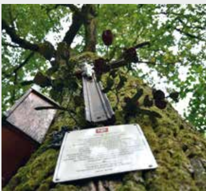
Dąb straceń.