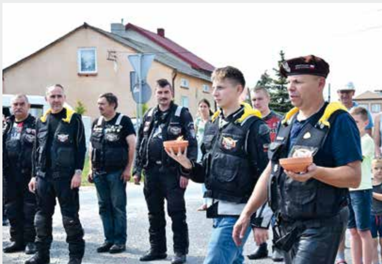
Zapalenie zniczy pod pomnikiem Trzech Krzyży.