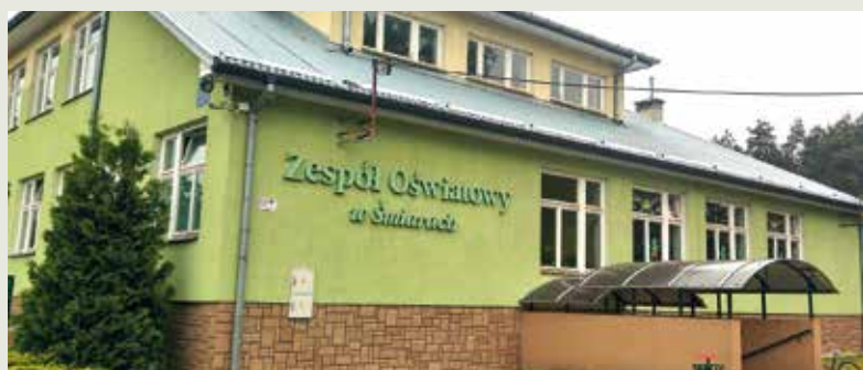
ZO Śmiary.