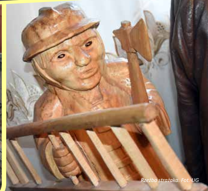
Rzeźba strażaka.