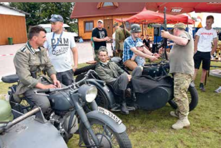
Grupa rekonstrukcyjna.

Organizatorzy pierwszego Spotkania z Techniką i Historią w Wiśniewie podsumowali tegoroczną imprezę. Ocena wypadła bardzo pozytywnie, dlatego jej pomysłodawcy już zapowiadają kolejne edycje.