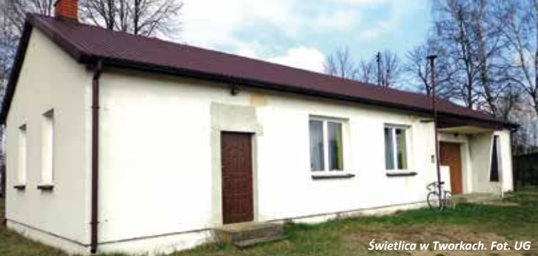
Świetlica w Tworkach.