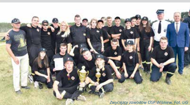
Zwycięzcy zawodów OSP Wiśniew.

Szkolenie przeprowadził Andrzej Dybowski , inspektor ds. Zarządzania Kryzysowego, OC i Obronności. wo