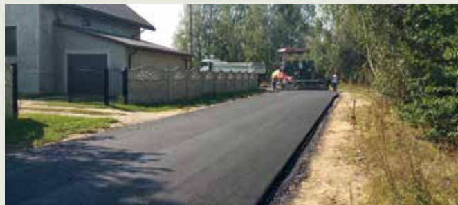
Droga w Zabłociu.

Trwają prace związane z uruchomieniem procedury przetargowej na wykonanie „ Przebudowy drogi gminnej przez wieś w Starych Okninach ”. Zadanie będzie obejmowało wykonanie nawierzchni asfaltowej na odcinku drogi o długości 787 m i szerokości 5 m wraz z budową poboczy. Szacowany koszt inwestycji to ok. 537 tys. zł.