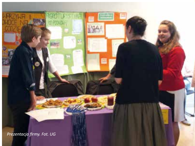
Prezentacja firmy.

Ponadto uczniowie w grupach rozwiązywali różnorodne zagadki matematyczne dotyczące tabliczki mnożenia. jn