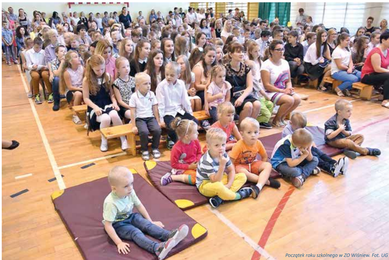
Początek roku szkolnego w ZO Wiśniew.