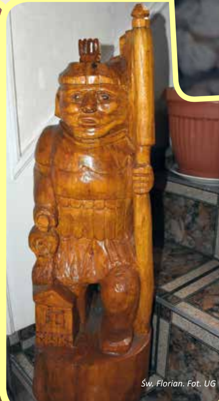
Św. Florian.