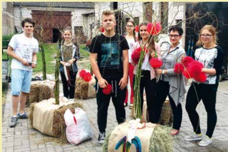
Uczestnicy warsztatów.

i umieszczonych w balonach koloru wiśniowego. Wraz z młodzieżą i dziećmi uczestniczącymi w projekcie życzą wszystkim aby zapisane i wysłane marzenia się spełniły. wo