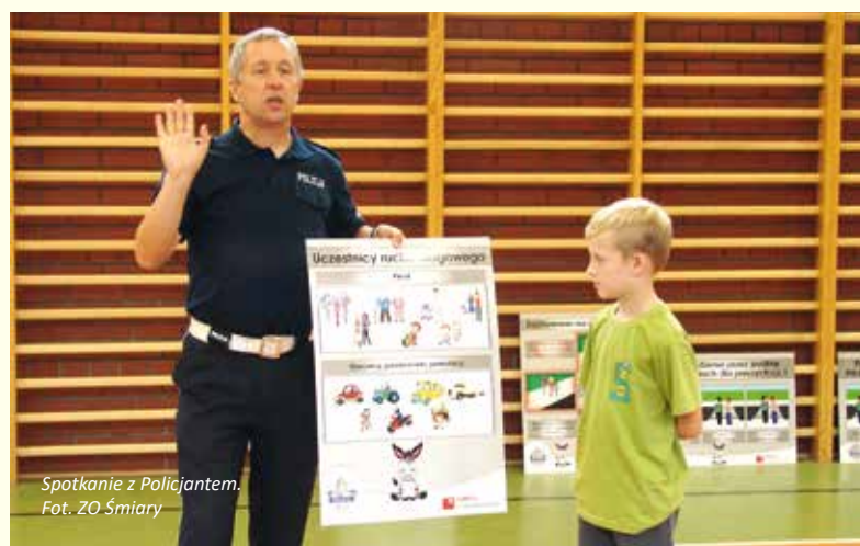
Spotkanie z policjantem.