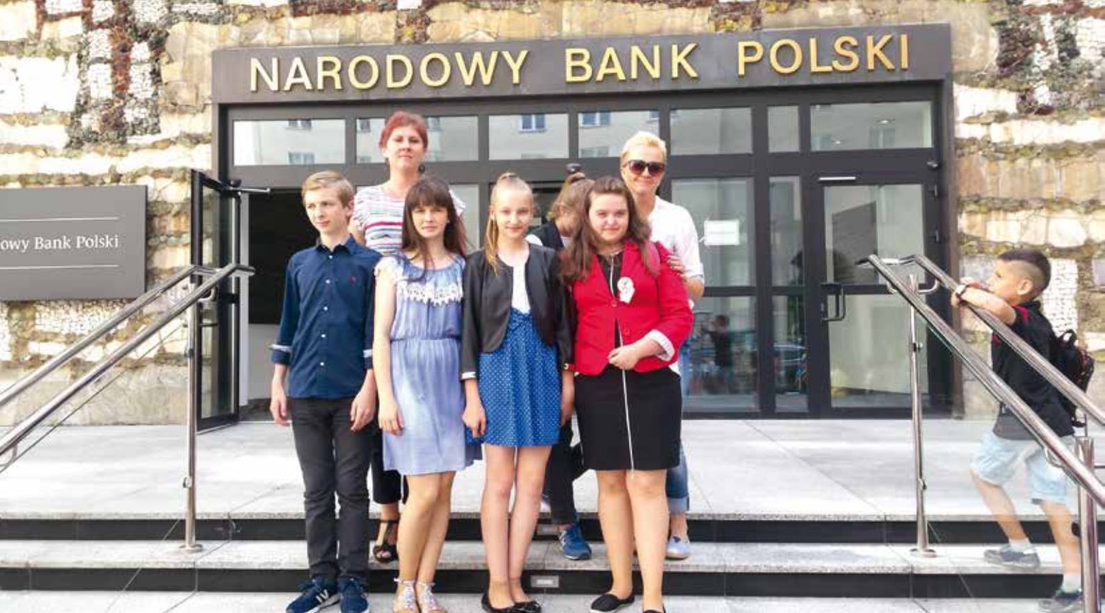
Przedsiębiorcze Radomyślanki wraz z opiekunami.