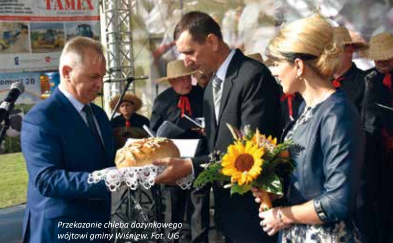
Przekazanie chleba dożynkowego wójtowi gminy Wiśniew.