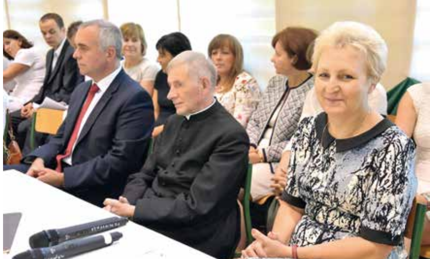
Nauczyciele ZO Wiśniew.