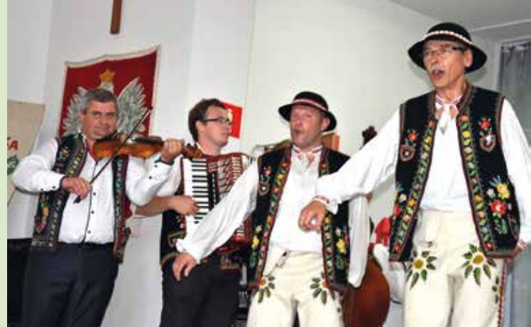
Kapela z solistą.