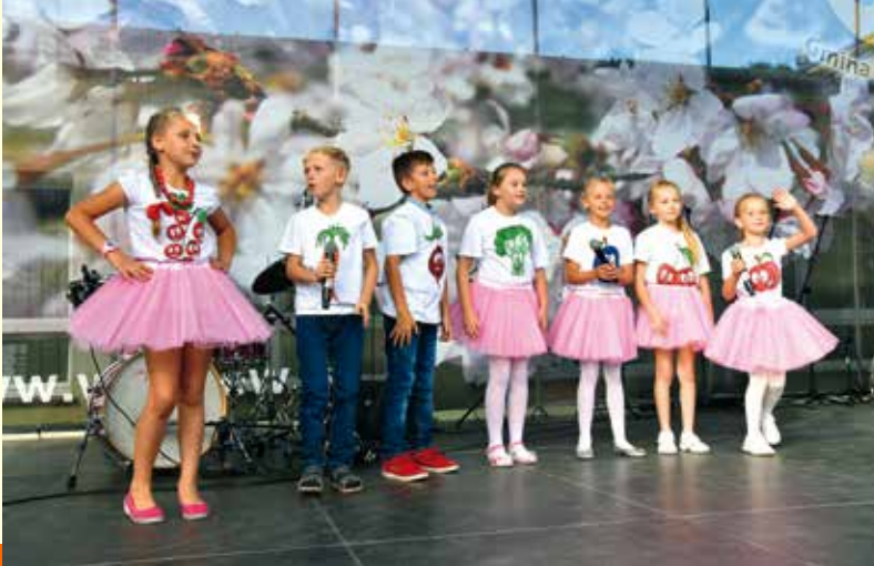
Uczniowie ZO Radomyśl podczas występu.