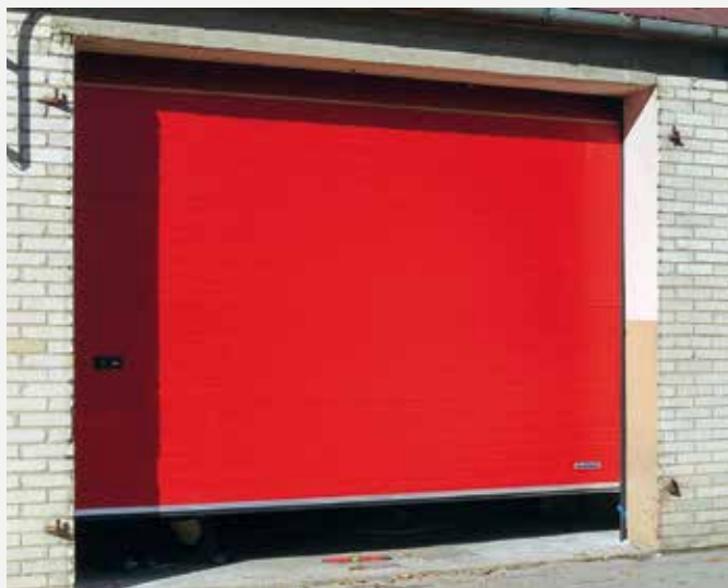
Brama garażowa w Łupinach.

W sierpniu br. podpisano dwie umowy na zakup i montaż czterech bram garażowych w budynkach garażowych OSP w Radomyśli i Łupinach. Dostawa i montaż bram zgodnie z umowami powinna odbyć się do 21 października. Łączny koszt dostawy i montażu wynosi blisko 21 tys. zł. W budżecie Gminy przewidziano również do realizacji zakup i montaż bramy garażowej do strażnicy w Wólce Wiśniewskiej.