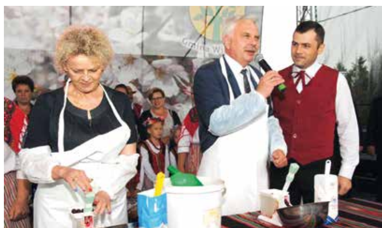
Ceremonia zasypywania wiśni.