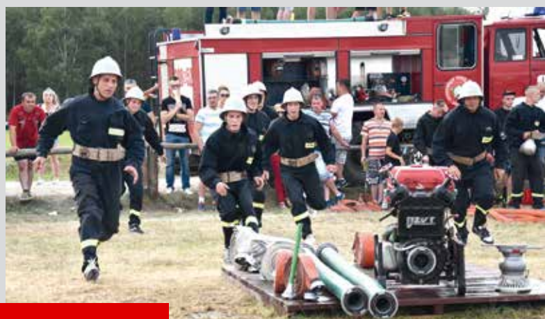
Ćwiczenie bojowe wykonuje OSP Stare Okniny.