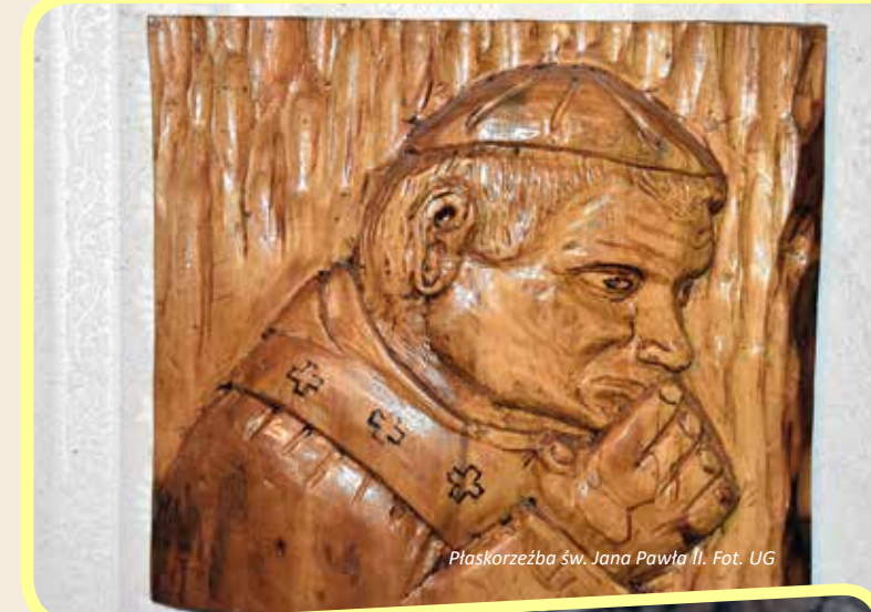
Plaskorzeźba św. Jana Pawła II.