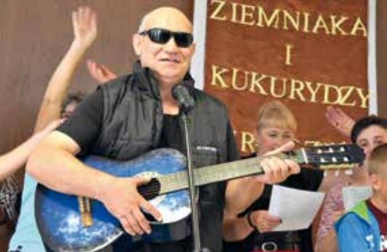
Nowe sceniczne wcielenie sołtysa.