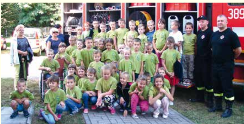
Spotkanie ze strażakami.

20.09.2016 r. po raz pierwszy obchodziliśmy Dzień Przedszkolaka. Z tej okazji Samorząd Uczniowski wybrał się w odwiedziny do naszych najmłodszych dzieciaczek. Złożył im najserdeczniejsze życzenia: mnóstwo radości, uśmiechów... Potem wszyscy razem uczyli się tańca. Przedszkolaki świetnie się przy tym bawili.