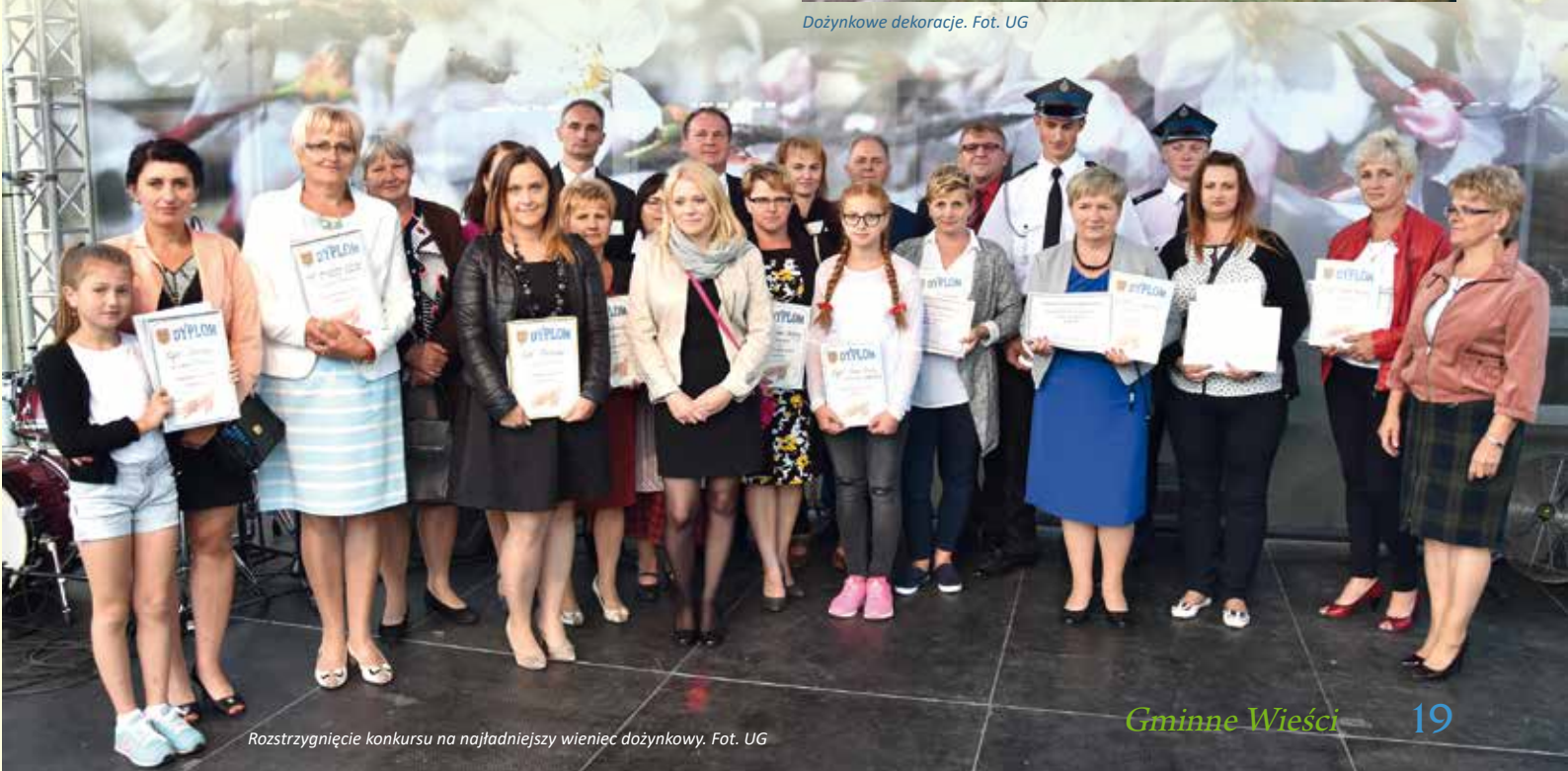
Rozstrzygnięcie konkursu na najładniejszy wieniec dożynkowy.