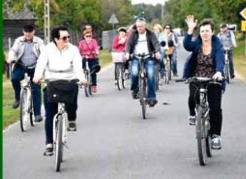
Uczestnicy rajdu.