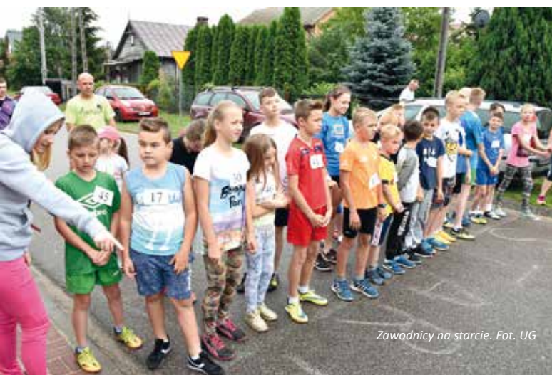
Zawodnicy na starcie.

Podsumowując tegoroczną uroczystość Pan Wójt stwierdził, iż - jest to sztanarowa impreza naszej gminy. Celem Festiwalu jest