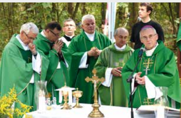
Mszę świętą koncelebrował biskup Kazimierz Gurda.