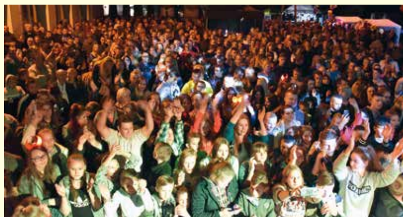
Zgromadzona publiczność.