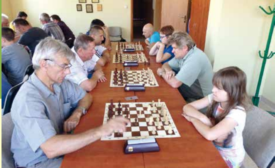
Zawodnicy w trakcie turnieju.