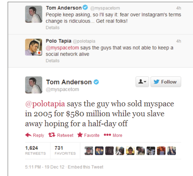
Abbildung 1.1 MySpace-Gründer Tom Anderson »grillt« einen Hater.

sen Internetzugang ermöglichen. Und Elon Musk, einer der Gründer von PayPal und Tesla, baut Raketen, die zum Mars fliegen. Mit dem eigenen Erfolg geben nur die Wenigsten an (siehe Abbildung 1.1).