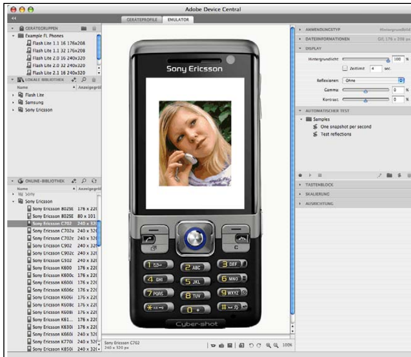
Abbildung 3: Sie können noch vor dem Speichern beurteilen, wie sich das Bild darstellen wird.