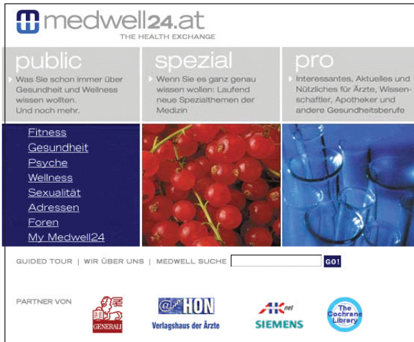
◀ Abbildung 1 Babylonische Sprachverwirrung: Eine Tagline sollte den Zweck der Site erklären, englischer Text – »Health Exchange« ist dabei nicht gerade hilfreich. Und der Begriff »Guided Tour« mag EDV-Experten bekannt sein, Durchschnittsbenutzern aber vermutlich nicht.