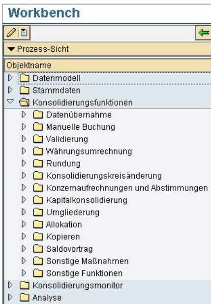
Abbildung 1 Zentrale Bereiche der Workbench

Die Workbench erreichen Sie über die Transaktion UCWB. Hier können Sie alle Customizing-Einstellungen vornehmen, die für den Konzernabschluss benötigt werden. Die Workbench ist in mehrere Bereiche unterteilt: Der erste Bereich bezieht sich auf das Datenmodell. Die Einstellungen dafür werden im Abschnitt »Prozess der Abschlusserstellung« näher beleuchtet. Die zentralen Bereiche der Workbench sehen Sie in Abbildung 1.