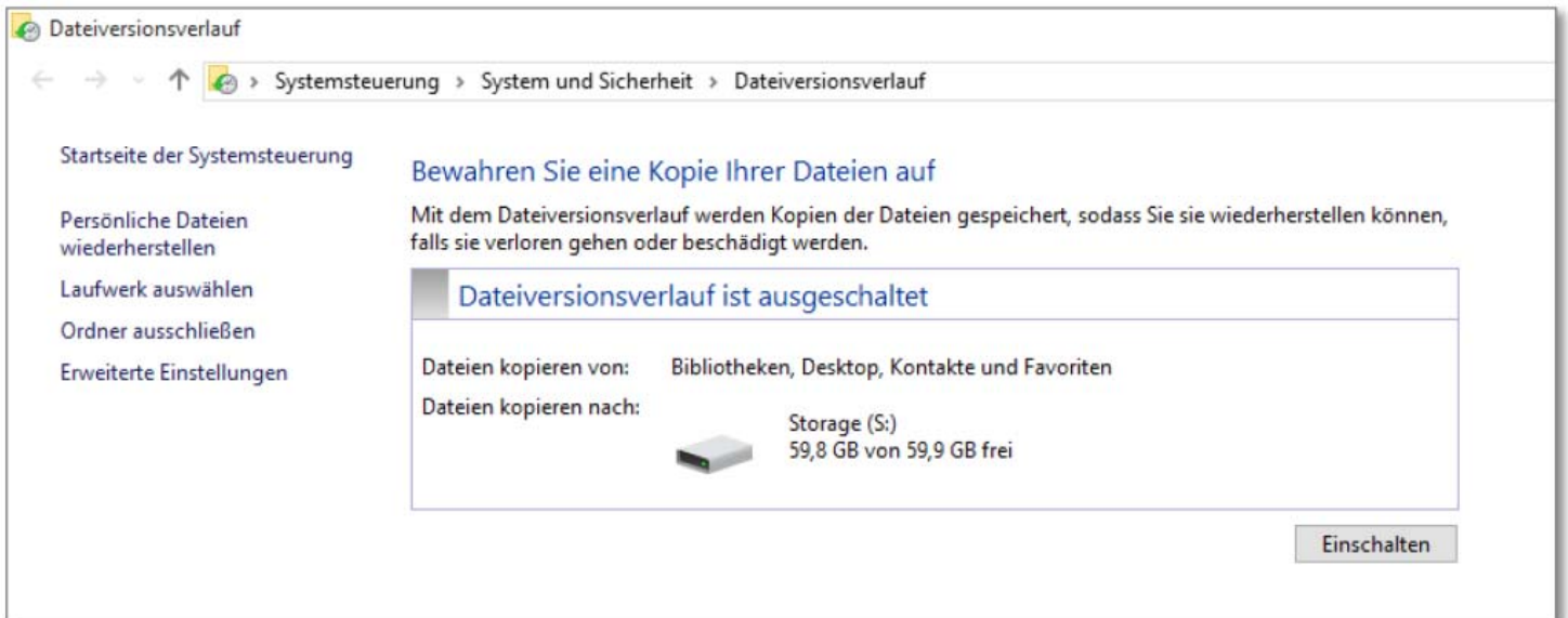
Abbildung 14.1 Den Dateiversionsverlauf aufrufen

Hier kam es bei einem Kunden zu Irritationen. Im Buch steht, dass laut Microsoft Telemetriedaten weniger als 5% der Benutzer das „klassische“ Windows Sicherungsprogramm nutzten und man darum den Dateiversionsverlauf entwickelt habe. Aus dieser Aussage kann man schließen, dass es das klassische Sicherungsprogramm und vor allem der Systemabbild-Mechanismus in Windows 10 nicht mehr an Bord sei. Dies wird noch unterstrichen durch diese Abbildung: