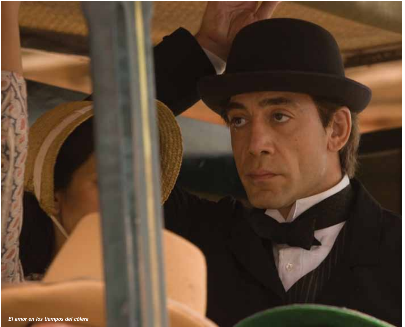
El amor en los tiempos del cólera

Javier Bardem tiene una expresión dura en la cara: tiene la nariz rota y los ojos hundidos 1 . Parece un matón 2 del Bronx o un boxeador de segunda clase o un campesino español. Tiene dignidad, orgullo y talento, una combinación perfecta para ser un gran actor. Ha trabajado con Woody Allen y los hermanos Coen.