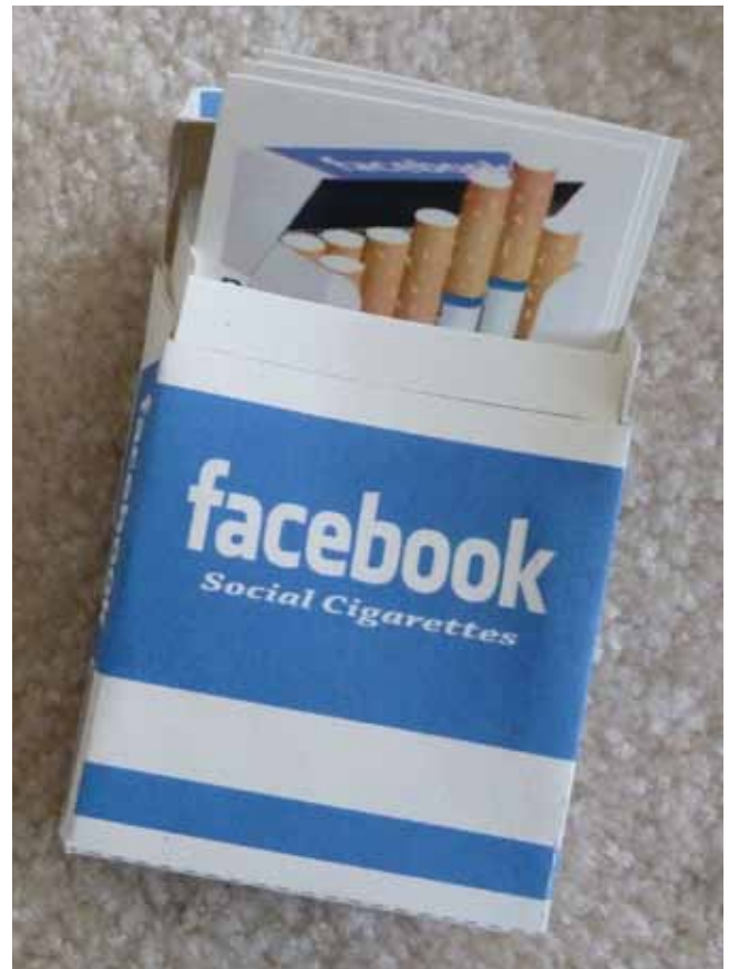
Facebook Cigarettes / 2wenty

Para un público general, la dopamina es el neurotransmisor del amor, del placer y del vicio 1 . Para los que trabajamos en trastornos 2 neurológicos, la dopamina es aprendizaje y es sufrimiento; es el neurotransmisor del párkinson, de la esquizofrenia, de la adicción. Pero ¿es también el neurotransmisor de las redes sociales 3 ? Podría ser, pero de momento no existe ninguna evidencia científica en la que pueda basarse esta afirmación. Aun así, hay periodistas, divulgadores 4 y comunicadores que afirman que las redes sociales se aprovechan de que nuestro cerebro produce dopamina cada vez que alguien nos da un like en Facebook o