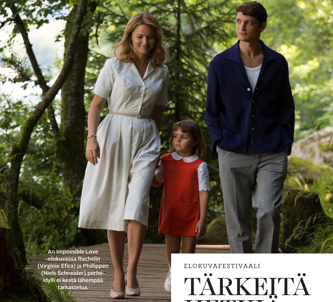
An Impossible Love -elokuvassa Rachelin (Virginie Efira) ja Phillippen (Niels Schneider) perheydylly ei kestä lähempää tarkastelua.