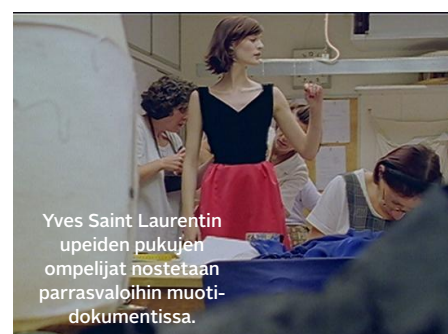
Yves Saint Laurentin upeiden pukujen ompelijat nostetaan parrasvaloihin muoti-dokumentissa.