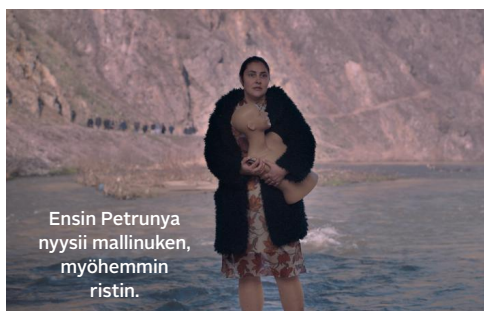
Ensin Petrunya nysii mallinuken, myöhemmin ristin.