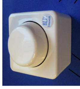
BLP-LED dimmer 60 x 60 mm Vit