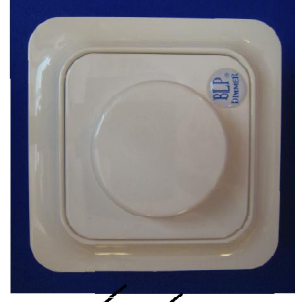
BLP-LED dimmer 82 x 82 mm Vit typ, ELJO polarvit