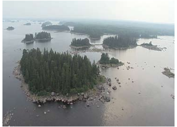
Der Axmarer Schären Garten von oben.

Der Ort, an dem die Beda liegt, ist einer von 9 Standorten ringsum Axmar, die vor dem Sommer 2015 mit Bojen und Informationsschildern versehen werden. Die Absicht ist, die Unterwasserwelt etwas zugänglicher zu machen. Einige Plätze können gut von Land erreicht