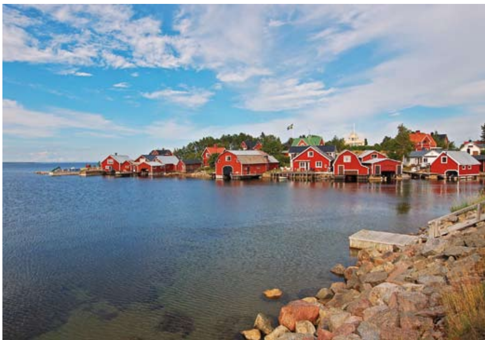
Rönnskär, eine Insel vor Stocka gelegen, wo früher "prima klabbströmming" eingesalzen wurde (Hering, der auf eine spezielle Art gefischt wurde).

In den meisten Fischerdörfern wurde eine einfache Kapelle gebaut. Der Hafen, die Kapelle und das Bäckerhäuschen gehörten gemeinsam den Einwohnern des Dorfes. Damit das Leben im Hafen und die Arbeit mit dem Fischen reibungslos funktionierte, gab es eine Art Hafenzunft, in der alle Fischer Mitglieder waren. Die Hafenzunft hatte einen Hafenaufseher als Vorsitzender, und die Zunft wurde durch eine Hafenvorschrift geregelt, die jeweils vor Beginn des Sommerfischens in der Kapelle verlesen wurde. Derjenige der den Hafenvorschrift zuwiderhandelte, z.B. Fischereigeräte eines anderen Fischers zerstörte, konnte zu einer Geldstrafe verurteilt werden.