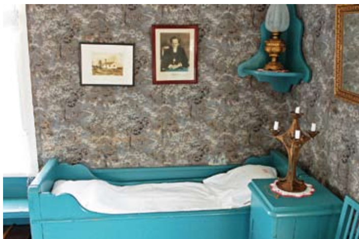
Die "Pfarrerzimmer" der Agö Kapelle, außerhalb von Hudiksvall, wurde im Jahre 1845 gebaut. Die Kapelle ist aus dem Jahre 1600.

Nahe am Wohnhaus lagen die Trockengestelle, die für das Trocknen der Netze verwendet wurden. Einige Fischerdörfer hatten auch ein gemeinsames Bäckerhäuschen.