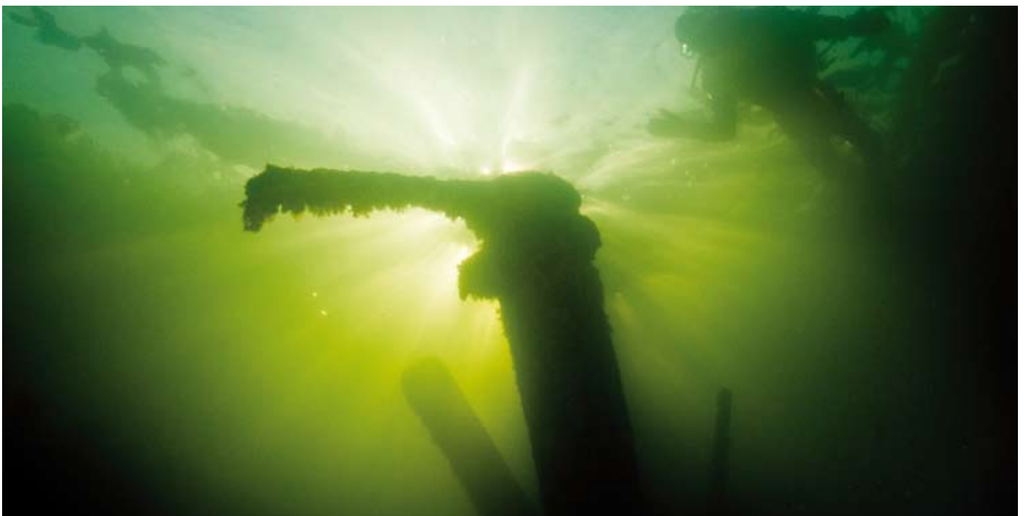
Wrack bei Oxelharen.