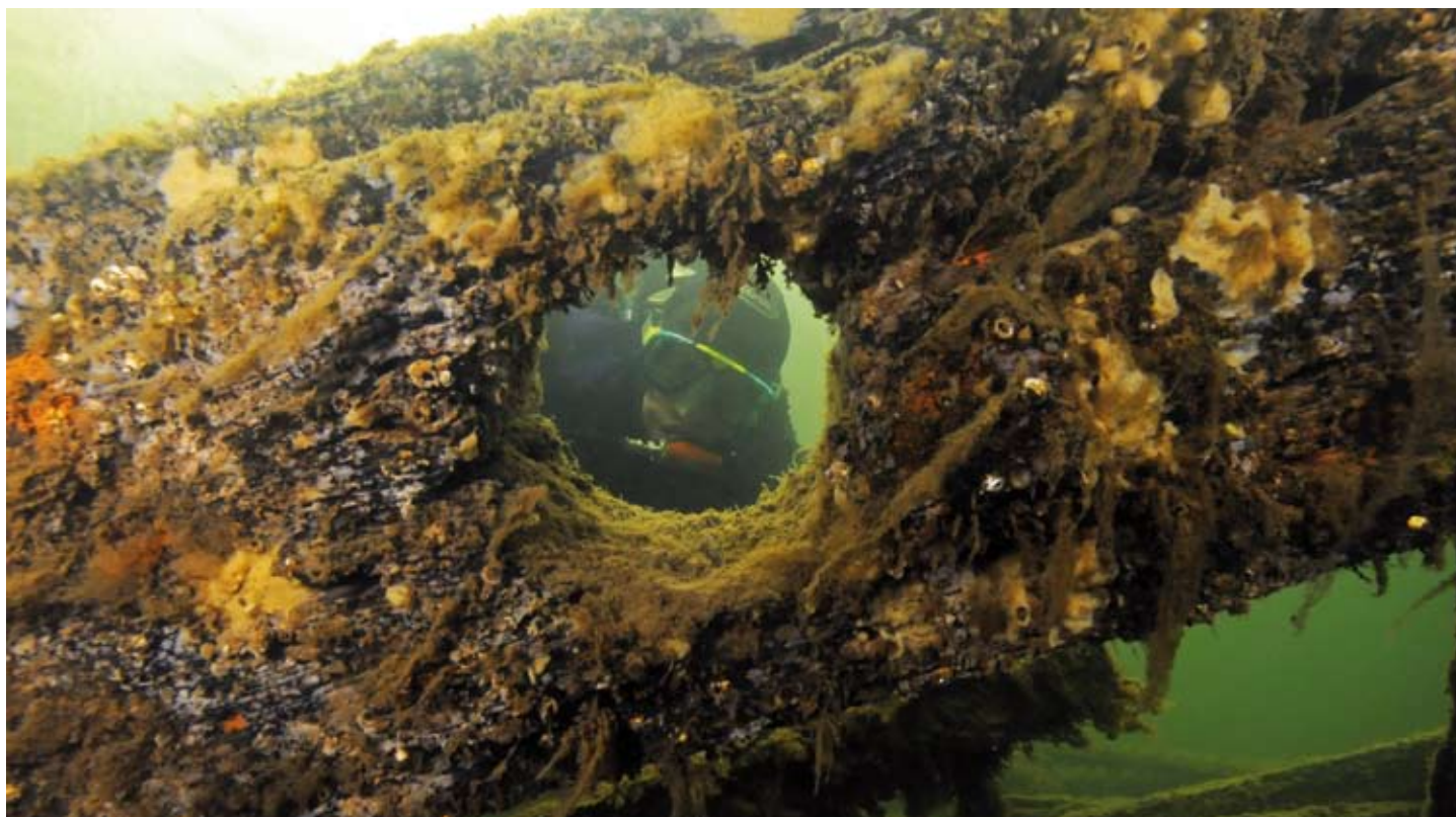
Lastkahnwrack bei Malmbaren.

In den alten Tagen war der Schiffahrtsweg entlang der Jungfrauenküste genauso wichtig wie die Autobahn E4 heutzutage. Jahrhundertlang flossen Frachtgüter und Passagiere in einem stetigen Strom zwischen Nordschweden und Stockholm – Region Mälarsee. Aber am Ende des neunzehnten Jahrhunderts veränderten sich die Dinge. Segel wurden gegen Dampf ausgetauscht, und noch später wurden die Dampfschiffe durch Eisenbahn und LKW ersetzt. Dies bedeutete große Veränderungen für Städte und Dörfer entlang der Jungfrauenküste: einige Plätze entwickelten sich weiter, während andere stagnierten. Hüttenorte wie Galtström, Långvind und die Axmarer Eisenhütte (Axmar Bruk) gingen in den Ruhestand. Erst in den letzten Jahren wurden sie zu neuem Leben erweckt - als Besucherziel. Und was heute Touristen anzieht, ist genau das, was diese Plätze einst unmodern machte: alte Gebäude und Anlagen, sowie die Lage im Schärengarten.