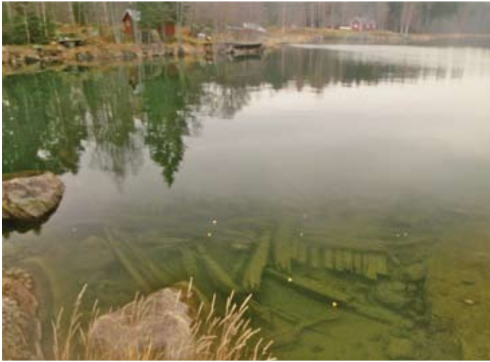
Zerbrochenes Segelschiff bei Sundsmar.

Wir schreiben Ende September im Jahre 1883, als sich die Schaluppe Beda af Harg in Strömsholm in der Region Västmanland befand, um Eisenerz zu laden. Nach der Beladung steuerte Kapitän Eriksson das Schiff über den Mälarensee hinaus, weiter nordwärts auf dem inneren Schifffahrtsweg der Ostsee. Das Endziel des Eisenerzes war Axmar Bruk. In der Nacht zwischen dem 4. und 5. Oktober 1883 fuhr das Schiff um die Landzunge Sundmarsnäset und man konnte fast schon den Hochofen der Axmarer Eisenhütte sehen. Dann fuhr das Schiff auf Grund, der Schiffsrumpf füllte sich mit Wasser und die Beda af Harg driftete gegen die Landspitze Svartstensudden, wo sie Schiffbruch erlitt. Die Besatzung kam noch einmal mit dem Leben davon. Das Dampfschiff Dalelfen , das sich zufälligerweise in der Nähe befand, konnte den Kapitän und seine Besatzung aufnehmen. Das Schiff selbst war nicht mehr zu retten, nicht einmal die Ladung. Am Rande des Ufers liegt noch heute der Haufen mit Eisenerz, und hangabwärts auf 20 m Tiefe liegt der zerbrochene Schiffsrumpf.