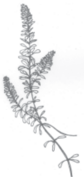
Illustration: Per Brunström, Hushållningssällskapet

nygrävda dammar, särskilt på gammal jordbruksmark, kan man få kraftig alg tillväxt, t ex. grönslick ( Cladophora glomerata ) pga. av höga närsalter. För att undvika oönskad alg tillväxt lade en odlare i en bal av råghalm i dammen.