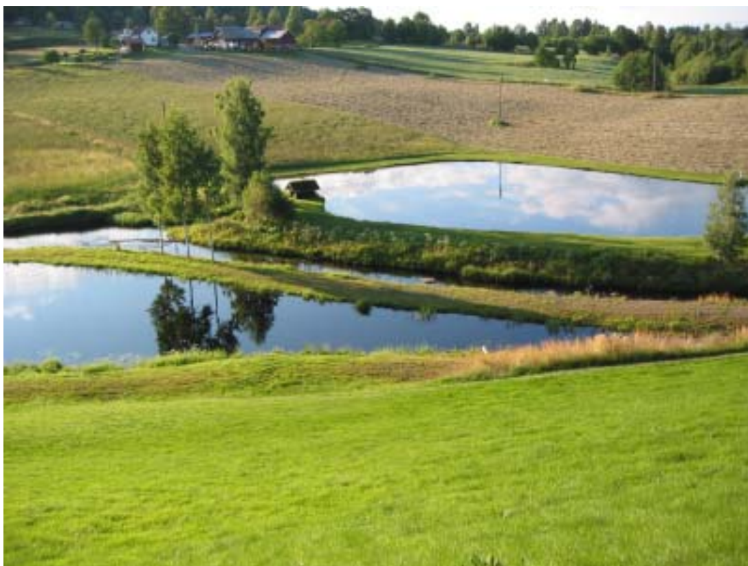
Dammar som utgör ett vackert inslag i kulturlandskapet.

Manualen riktar sig mot 2 olika huvudgrupper. 1:a kategorin har vi valt att kalla "hobbyodlaren" som eftersträvar att skapa en form av odling som närmast liknar ett naturvatten med målsättningen att producera kräftor för eget bruk. 2:a kategorin är personer som avser att etablera sig som odlare i ett större samband och med ett tydligt vinstsyfte. Kanske är den 1:a kategorin den viktigaste med målet att bevara flodkräftan som art. Produktion av flodkräftor bör ses som ett komplement till annan affärsverksamhet. Det finns tre olika om-