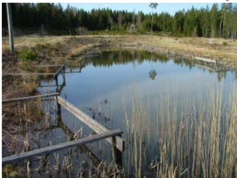
En damm som är ett mellanting mellan oval och rektangulär.

perforera dammvallarna vilket medförde vattenläckage. Om läckaget blir för kraftigt kan detta skära sönder dammvallarna som därmed kan kollapsa. Liksom vattensork kan även kräftorna perforera dammvallarna kraftigt, det har en odlare på Gotland erfarit. Det kan även vara ett tecken på att det finns för lite gömslen i förhållande till tätheterna i dammen.