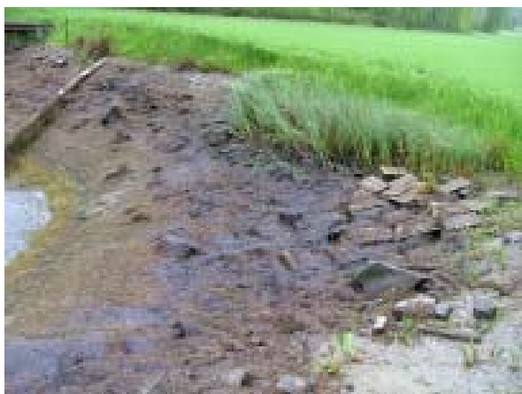
En tömd damm som visar hur vattenpest breder ut sig som en matta över botten.

Kräftorna åter inte vissa växtarter, därmed är det viktigt att inte plantera in sådana växter. Exempel på sådana vattenväxter är flytbladsväxter och vattenpest ( Elodea ). Om vattenpesten får fäste i en damm kan det få förödande konsekvenser. De kan växa i stor omfattning på mycket kort tid, och kan mer eller mindre ”begrava” botten av en damm vilket givetvis påverkar syrgasförhållandet avsevärt. Hos en odlare i Norge har vattenpest spontant utvecklats explosionsartat under 2-3 år. Bottarna i dammarna är numera heltäckta med oönskad vattenpest. Odlaren vet inte hur dessa kommit till dammarna men han misstänker fåglar. I