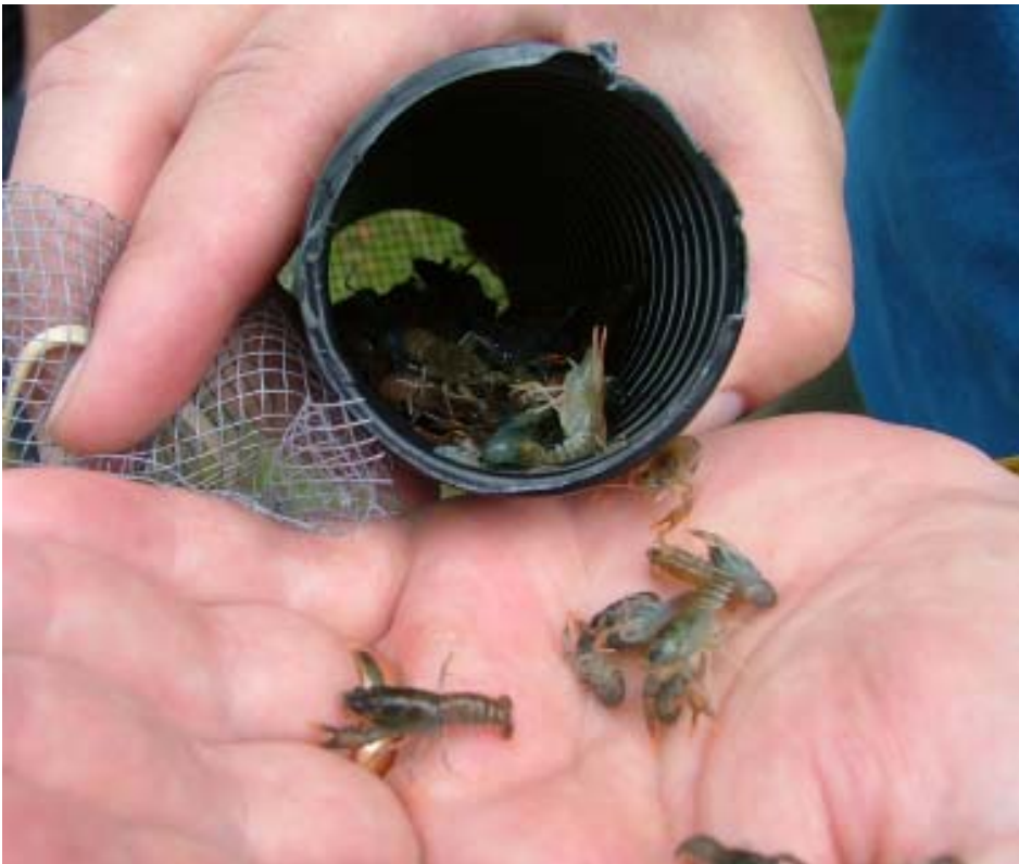
Stadium IV, yngel som är redo för utsättning.