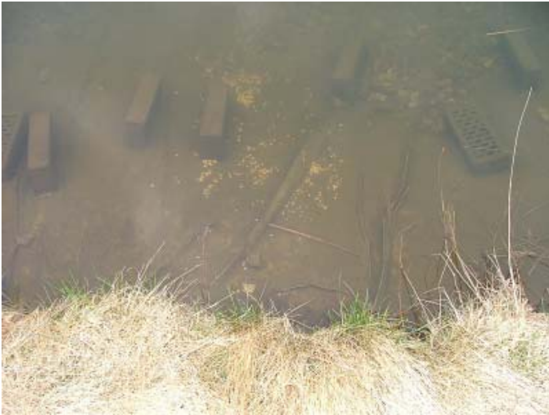
Kräftorna har nyligen utfodrats med ogroddad havre.