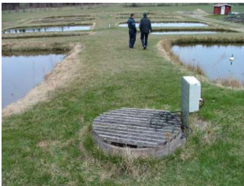
Exempel på ett slutet odlings-system. Fyra dammar är kopplade till ett recirkulerande system. Vattnet pumpas runt i dammarna. Vatten fylls på, via grundvatten, endast vid behov.

* Man måste veta varifrån vattnet har sitt ursprung. Kommer tillflödet från ett system som innehåller kräftor måste man vara mycket uppmärksam. Drabbas systemet av t ex kräftpest kommer detta även att slå ut odlingen.