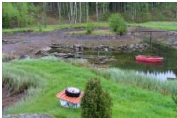
En damm som är både "flikig" och med öar.