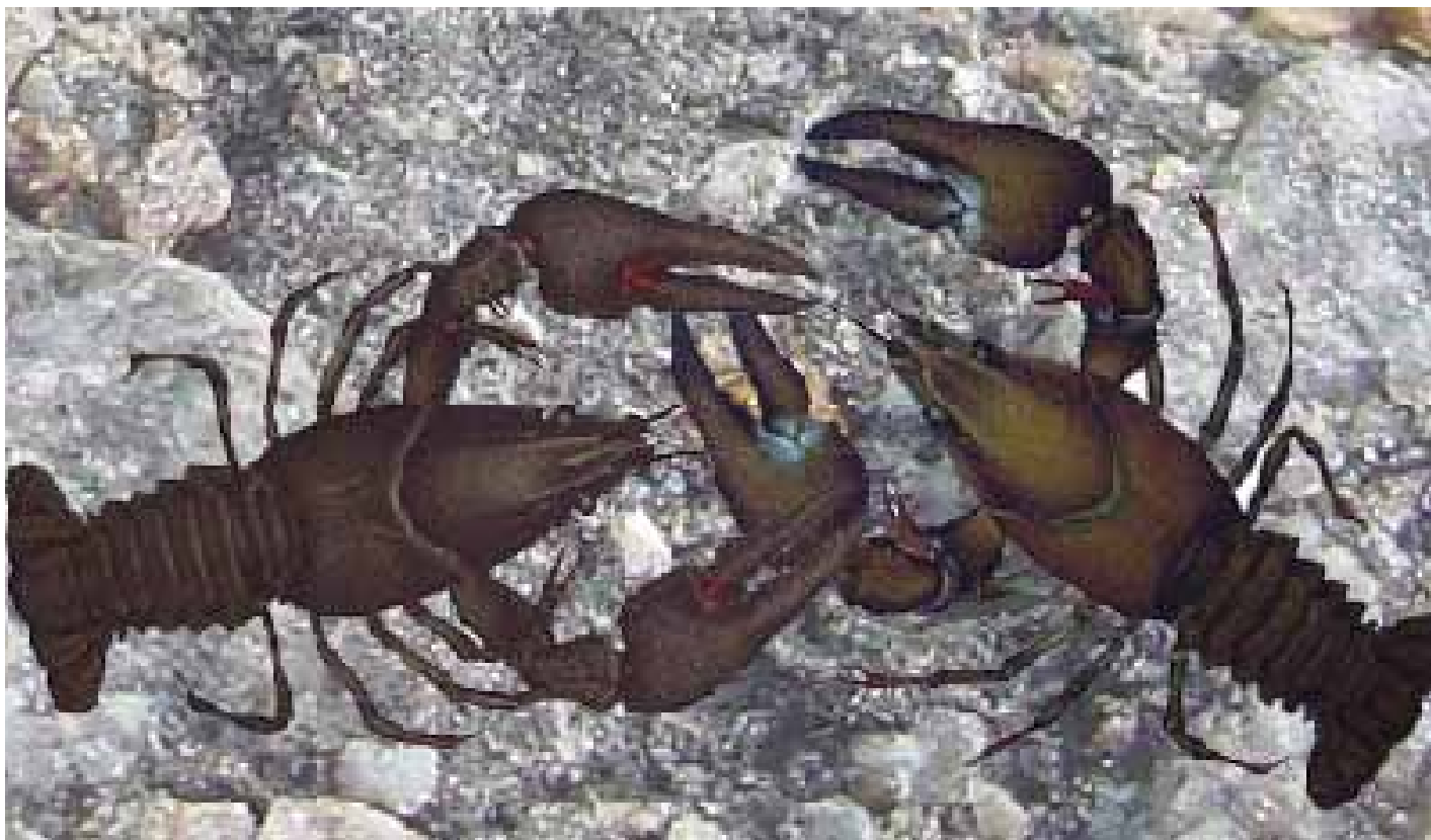
Flodkräfta till vänster och signalkräfta till höger. Lägg märke till de ljusa fläckarna på signalkräftans klor.

Eftersom signalkräfter sedan 1994 inte får planteras ut i vattenområden där arten idag saknas är det framför allt de illegala utsättningar av signalkräfter som är det största hotet mot flodkräftan idag.