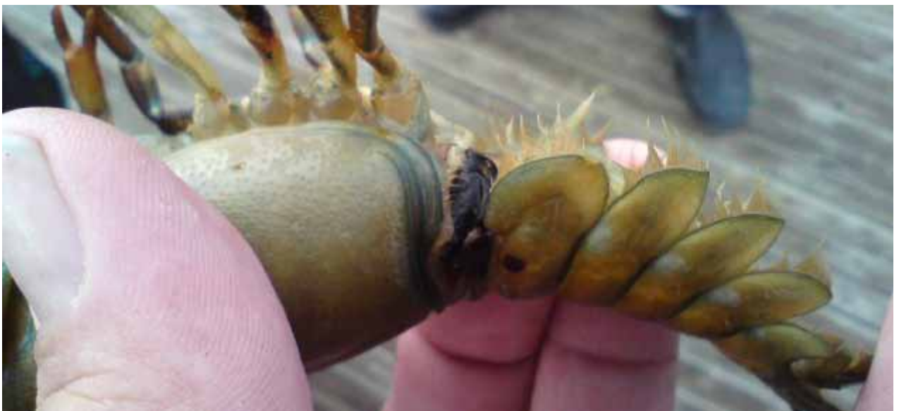
Angrepp av kräftpest på kräfta fångad i Vänern.