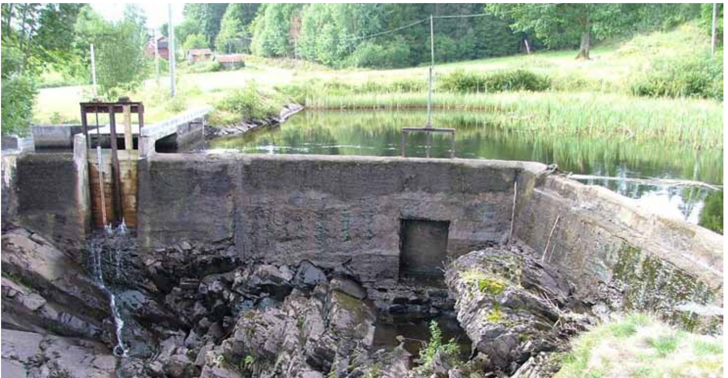
Regleringsdam vid Teåkersälven.

Vid förflyttning av fiskredskap från ett vatten till ett annat kan smittade kräftdelar följa med och dessutom kan kräftfiskeredskap som kommit i kontakt med smittade kräftor föra smittan vidare om de använts i andra vatten utan föregående desinficering eller uttorkning. Sporer kan även spridas genom att de fäster i slemskiktet hos fisk eller att fisk ätit smittade kräftor och via avföringen sprids sporena vidare.