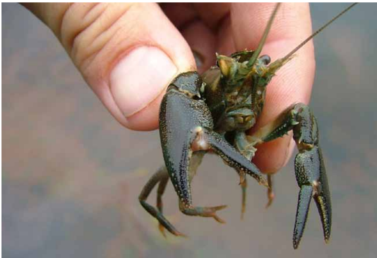
Illegalt utplanterad signalkräfta påträffad i en sjö i Värmland.