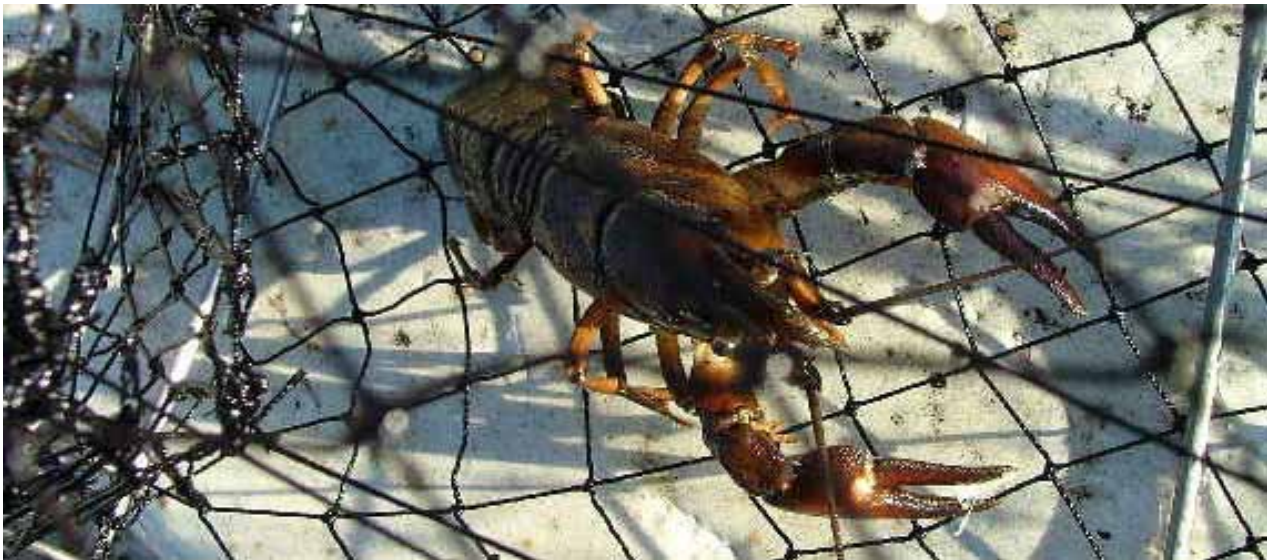
Illegalt utplanterad sigalkräfta i Fjällsjön, Eda kommun.