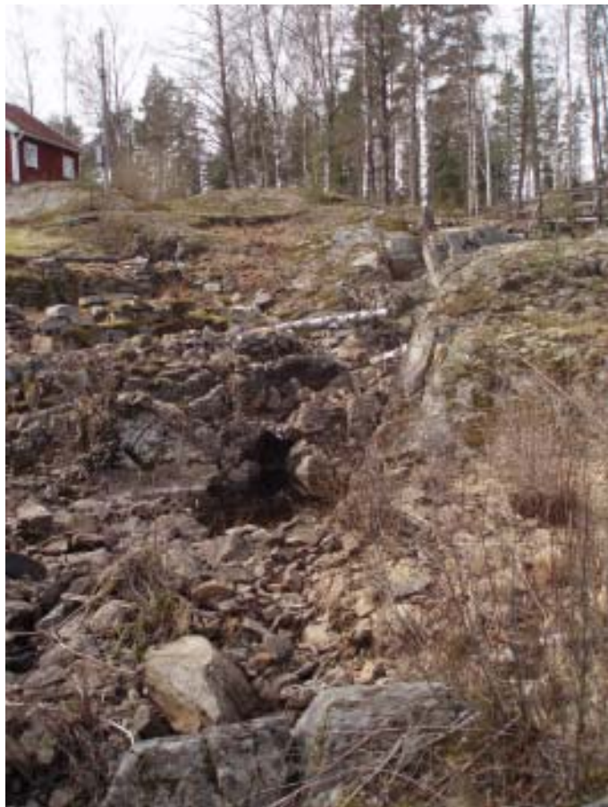
Torrfåran Strömmens kraftverk.