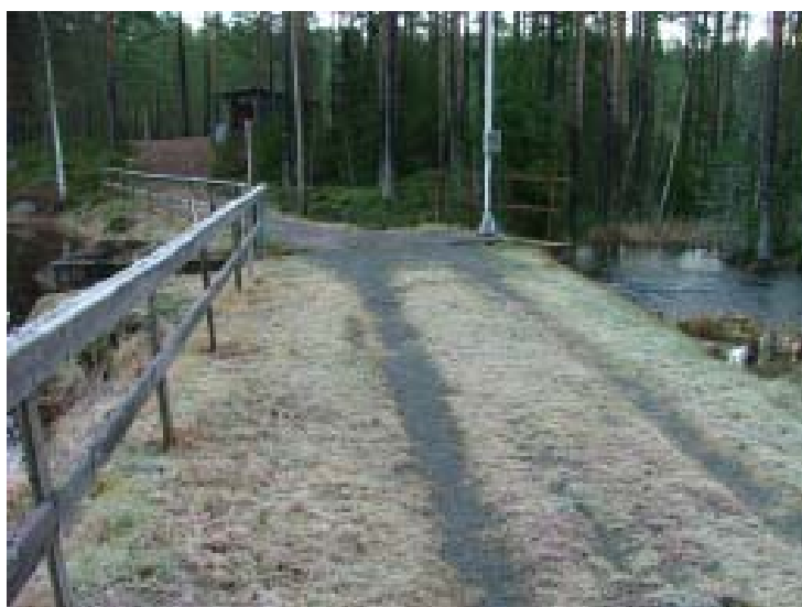
Dammen vid utloppet ur Stor Jangen.