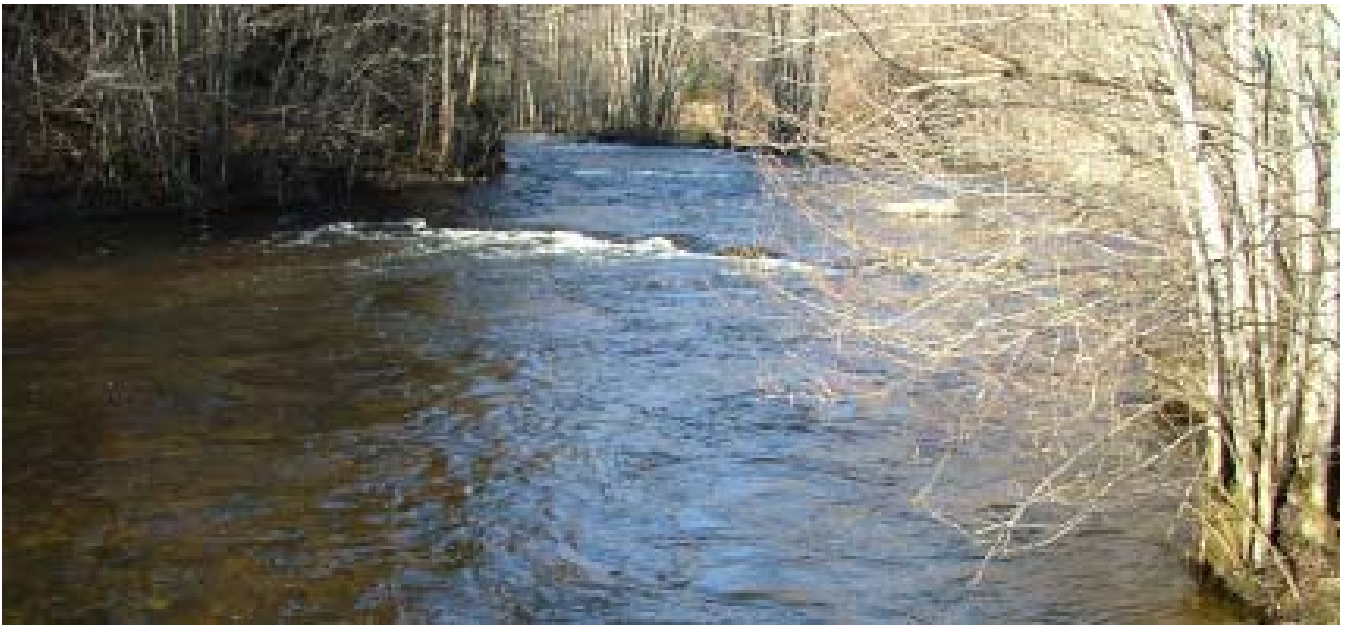
Karlforsälven. Bilden är tagen i mars 2007 vilket förklarar det höga vattenståndet.