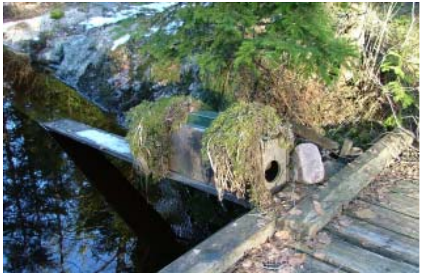
Effektiv minkjakt bedrivs i Åsebyälven.

Minkjakt bedrivs inom fvof. För varje nedfälld mink inkasseras 300: -. Sedan minkens inträde i området har den varit ett stort hot mot flodkräftbeståndet. När minken ökade minskade antalet stora kräftor i Åsebyälven påtagligt. 1985 påbörjades mink-