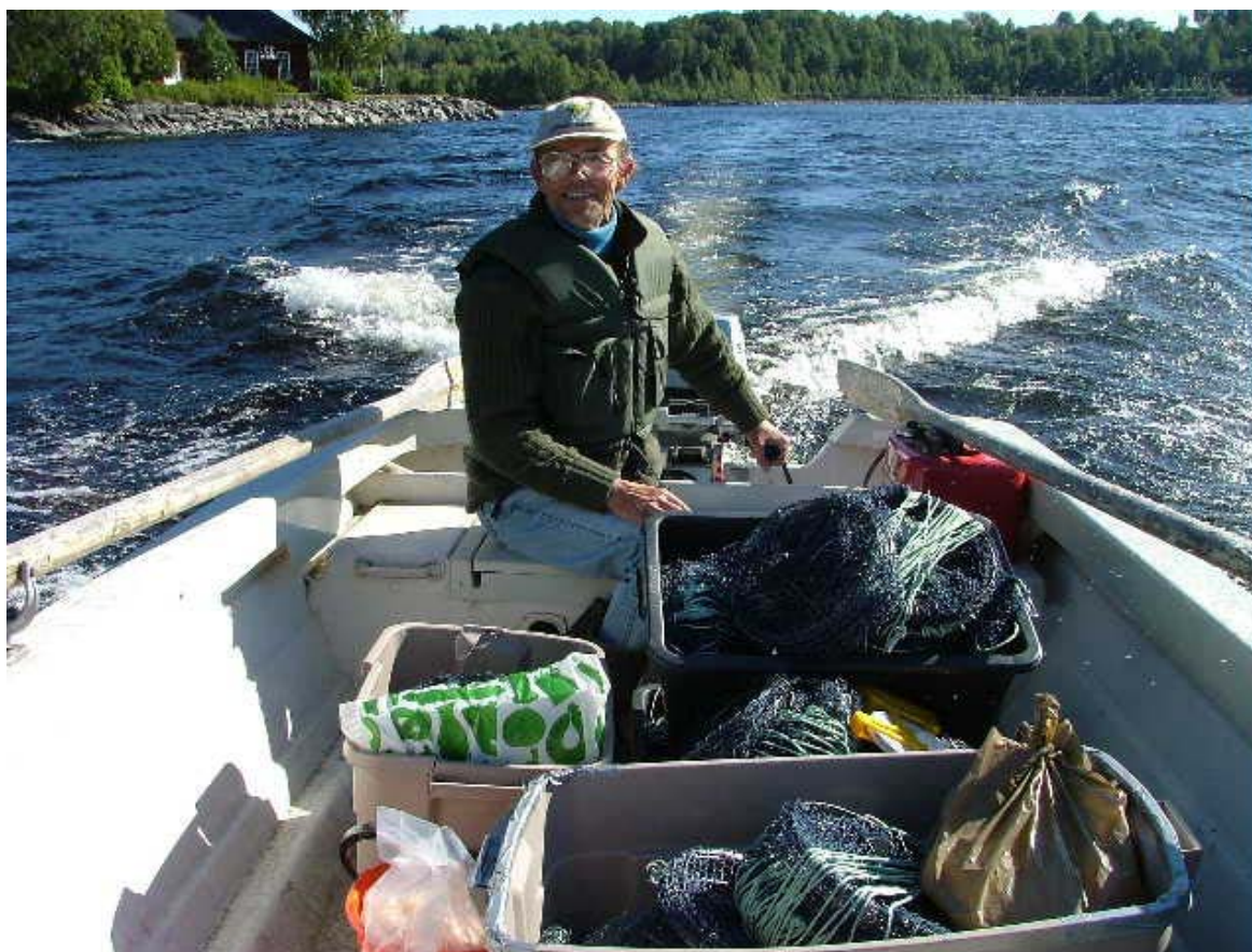
På väg mot kräftfiske med båten full av redskap.

I området finns en stor utbredning av flodkräftor med mycket god kvalitet. Vilket idag får betraktas som ovanligt, framförallt om man jämför med övriga Sverige. Flodkräftorna förekommer relativt högt upp i i källflödena, de sammankopplande vattendragen samt i flertalet sjöar. Historiskt har det varit mycket goda bestånd i framförallt i Magdebäcken, Svensbysjön och By-sjön. Fortfarande finns kräftor i två av dessa vatten men inte i samma utsträckning. Däremot är det mycket goda bestånd i Åsebyälven och Sandaälven. Området har aldrig drabbats av kräftpest men däremot har försurningen kraftigt decimerat kräftbeståndet, framförallt under 1970-1980-talet. Utöver flodkräftor hyser Järnsjön fvf sjövandrande öring, rödlistade och sällsynta arter av bottenfauna samt i Järnsjön och Magdebäcken förekommer även av glacialrelikter. För närvarande bedrivs inga fiskutsättningar i fvf.