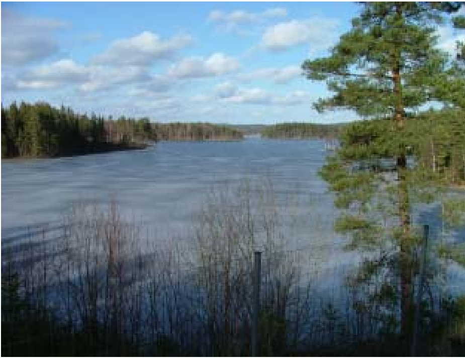
Bysjön, vintern 2007.