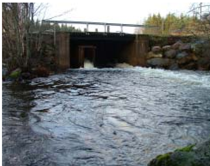
Utloppet, med fisketrappa, ur Stora Bör.