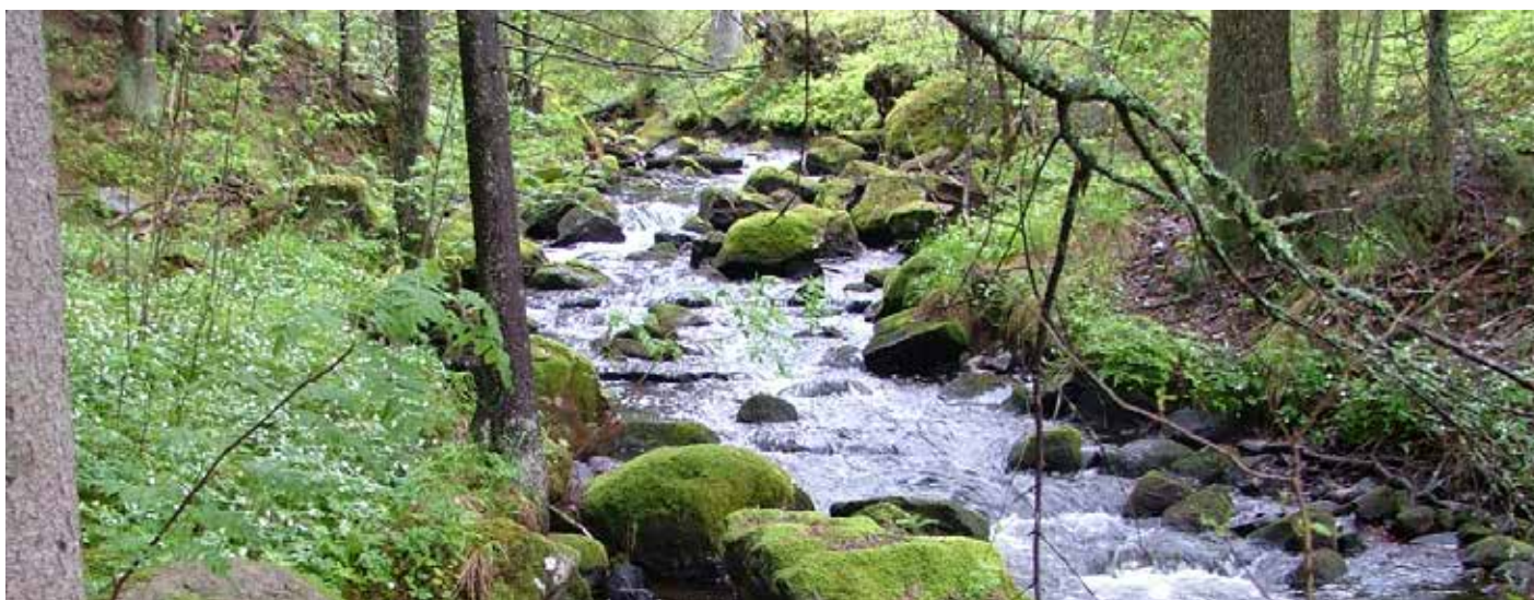
Stömnebäcken uppströms Hammartjärn.

Hushållningssällskapet Värmland Maj 2013 www.hushallningssallskapet.se/s www.raddaflodkraftan.se