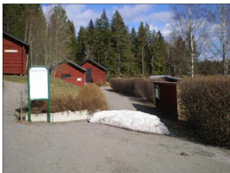
Den 6 april, 2007