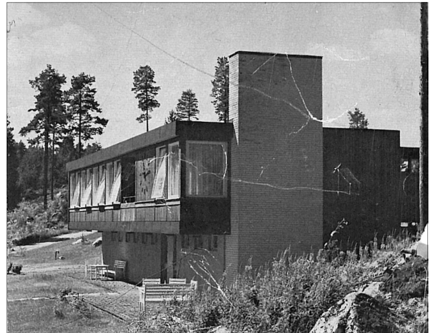
Så här såg det ut förr, lägg märke till balkongen, som numera ersatts med ett fönster. De stora ekarna var inte ens planterade. Uteserveringen? Var fanns kansliet?