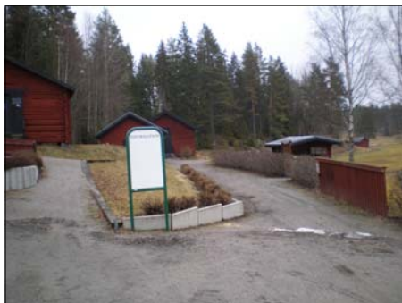
Den 3 april, 2008

Söderhamns Golfklubb, har liksom förra året beslutat att den 22 juni på Midsommarchansen stödjer vi "Pojkprojektet/Lillasyster" verksamheten med ett ekonomiskt bidrag.