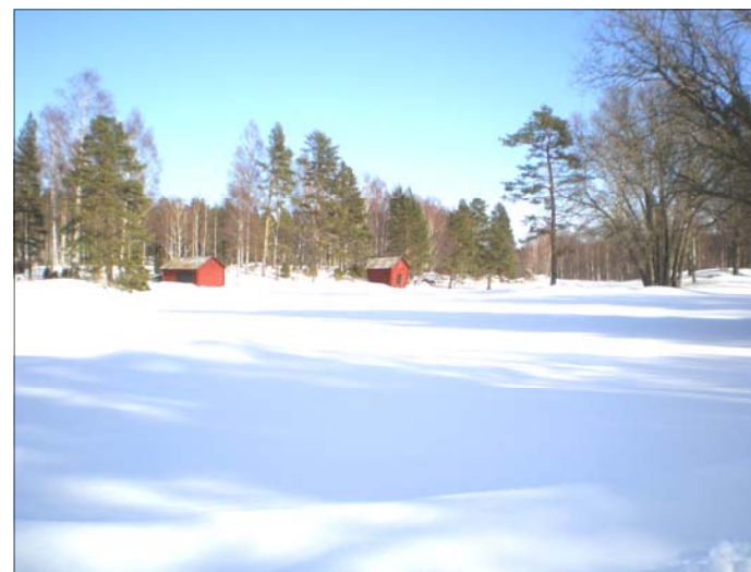
Mitten av mars 2009, ladorna på 2 ans fairway. Som ett vackert vykort, eller hur?