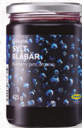
SYLT BLÅBÄR mermelada de arándanos $4.49 Orgánico 15oz. 703.086.28