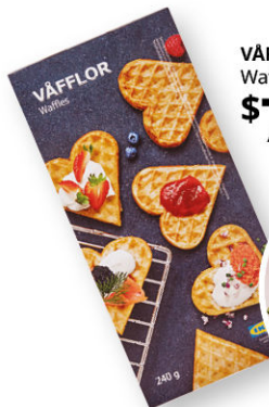
VÅFFLOR Waffles congelados $7 99