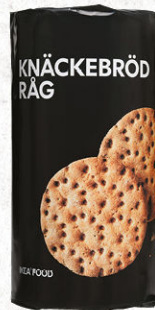
KNÄCKEBRÖD RÅG pan crujiente centeno $4.49 250g. 301.485.14