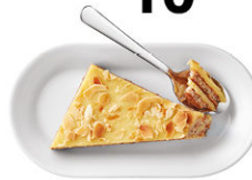
ALMONDY Pastel de almendras. 420g. 105.842.28 $10 99