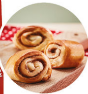
KAFFEREP rollos de canela, congelados $4.99 705.413.54