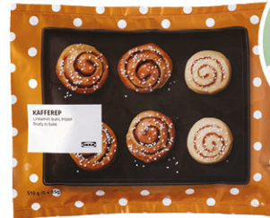
KAFFEREP rollos de canela, congelados $4.99 705.413.54