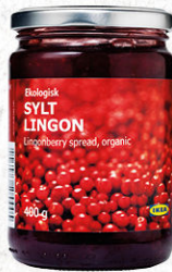
SYLT LINGON mermelada de lingonberry $4.49 Orgánico 14.1oz. 804.745.23