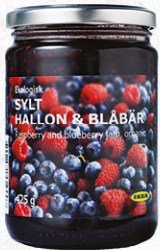
SYLT HALLON & BLÅBÄR mermelada de frambuesa/ arándanos $6.69 Orgánico 15oz. 702.881.02