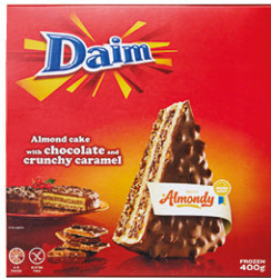
DAIM pastel de almendras, chocolate con caramelo $8.99 400g. 203.476.27

Cuando visites el Café Sueco en tu Tienda IKEA Carolina, no olvides llevarte las ricas tartas de almendras, o los tan afamados bollos de canela, para tus tardes de té y café.