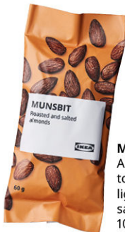
MUNSBIT Almendras tostadas, ligeramente salado. 60g. 104.840.16 1,95