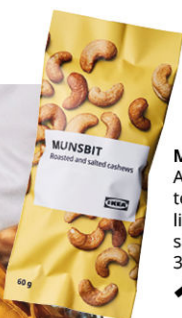
MUNSBIT Anacardos tostados, ligeramente salado. 60g. 304.840.15 1,95