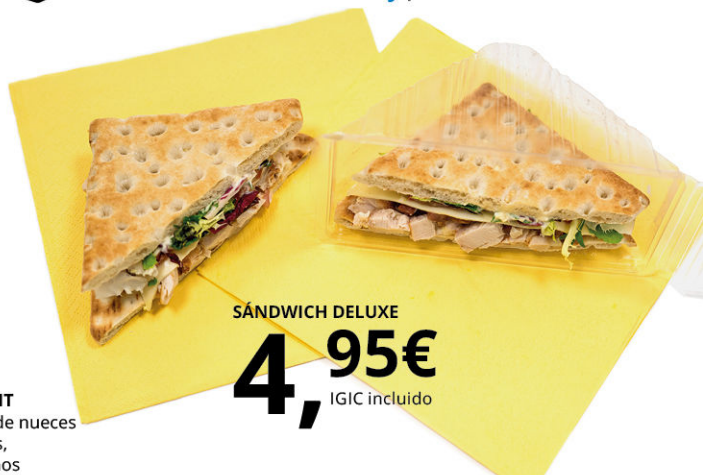
SÁNDWICH DELUXE 4,95€ IGIC incluido