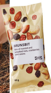
MUNSBIT Mezcla de nueces tostadas, arándanos y uva seco sin sal. 60g. 205.002.52 1,95

Escanea y descubre todo acerca del Bistro Sueco