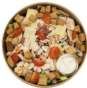
ENSALADA CÉSAR 5,95€ IGIC incluido