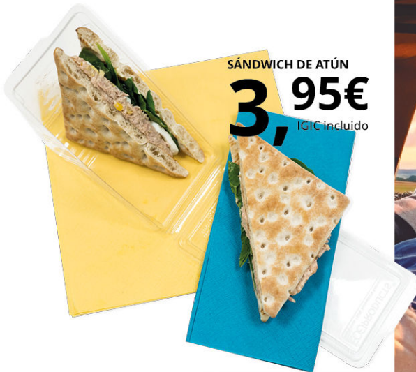
SÁNDWICH DE ATÚN 3,95€ IGIC incluido