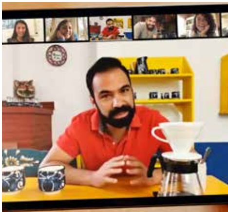
Onlineupplevelse från AirBnB, lektion i kaffe med en expert.

Göteborgsbryggeriet Poppels har erbjudit sina kunder en digital ölprovning där varje person har fått en lista på dryck och tilltugg att införskaffa, varpå själva avsmakningen har genomförts online. Även AirBnB Experience har öppnat för digitala upplevelser där matintresserade kan ta del av globala måltidsupplevelser från sitt eget hem, som att laga mexikanska tacos eller besöka en biodling i Portugal. Även Travelling Spoon erbjuder personliga, virtuella matlagningskurser med lokala hemmakockar från hela världen. Och matfestivalen Eat Art i Östersund valde att ställa om sitt program 2020 till digitala aktiviteter.