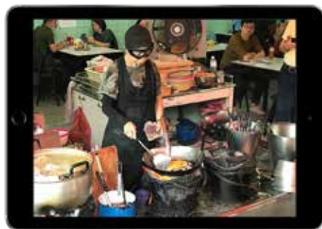
Kocken Jay Fai i sin restaurang i Bangkok, Thailand.

Trenden går mot att enklare och mer informella restauranger blir omnämnda i Michelinguiden. En del i detta är att restaurangbesökare söker just mer informella måltidsupplevelser utan att behöva göra avkall på kvaliteten. Kocken Jay Fai driver en restaurang i Bangkok, Thailand under namnet Jay Fai's shop. Restaurangen är en enkel, öppen lokal där maten lagas mesta dels i en wok över öppen eld av Jay Fai själv. 2018 fick Jay Fai en Michelinstjärna