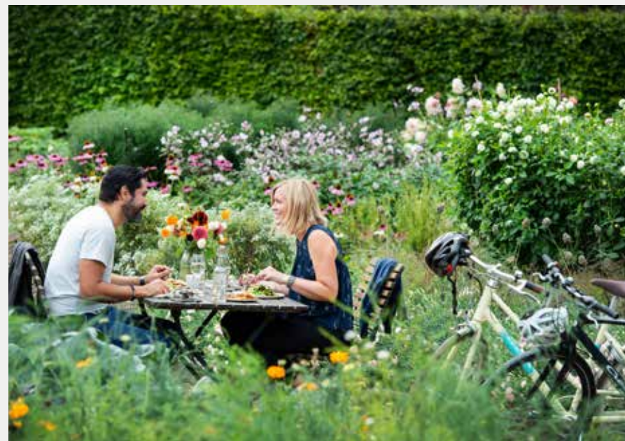
Lunch på Gunnebo Slott och Trädgårdar.

→ Digitaliserat utbud. Att kunna erbjuda en upplevelse digitalt är viktigt och kan vara en överlevnadsfråga beroende på hur lång tid det tar innan turismen återhämtar sig till samma nivå som innan covid-19. Undersök vilka tjänster det finns inom organisationen som kan digitaliseras och säljas eller användas inom marknadsföring. Det kan röra sig om digitala rundturer, smakprovningar av produkter, matlagningskurser av lokala rätter. Nya sändningsformat för live-sändningar via Facebook och Instagram är bra insteg för att laborera kring det digitala.