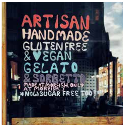
Att måltidsupplevelser ska möta fler förväntningar blir vanligare.

Alkohol är ett annat område där fler vill njuta utan dåligt samvete. Nya ölsorter har producerats som framhäver en minskad mängd kalorier eller en lägre alkoholhalt, senast Heineken med sin alkoholfria öl som stoltserade med endast 69 kalorier per flaska. För den som vill dricka utan alkohol växer nu även den alkoholfria marknaden stort med flera olika alternativ inom till exempel öl, vin, sprit, och cider.