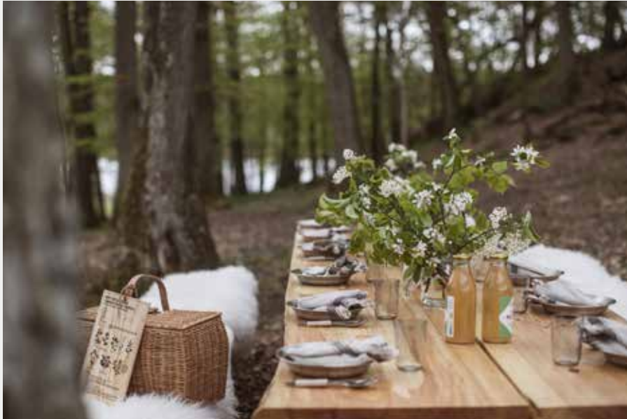
The Edible Country, en unik måltidsupplevelse utomhus.