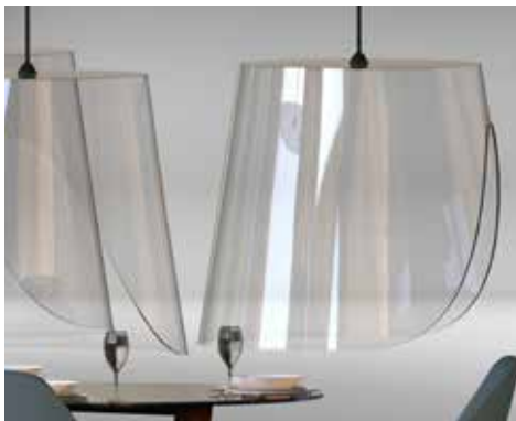
Restauranger inför flera nya lösningar för att säkerställa fysisk distans och hygien.