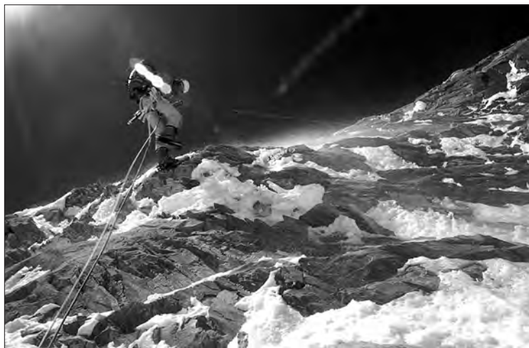
Rapelant la paret sud de l'Annapurna amb cordes de vuitanta metres.

Ja en plena nit, ens llencem pel pendent de glaç. Sentim la rimaia cada vegada més a prop. Les muntanyes del nostre entorn ja tornen a ser molt altes. Sento una càlida sensació d'impaciència per retrobar el campament base. Aquest, ara