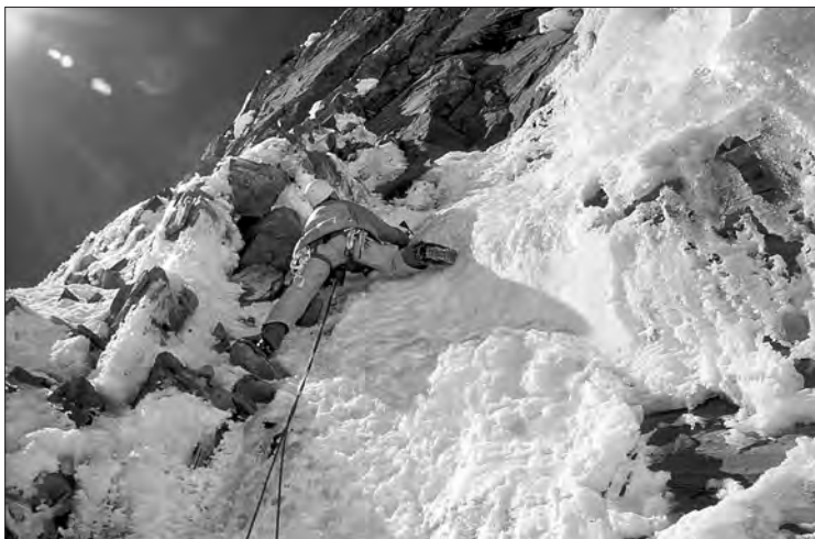
Annapurna. En Nil començant l'escalada del mur de roca i pas clau de la via. 7.200 metres.

Avancem lentament pel perfil de la neu. L'aresta va ascendint suaument davant nostre. El vent no amenaça