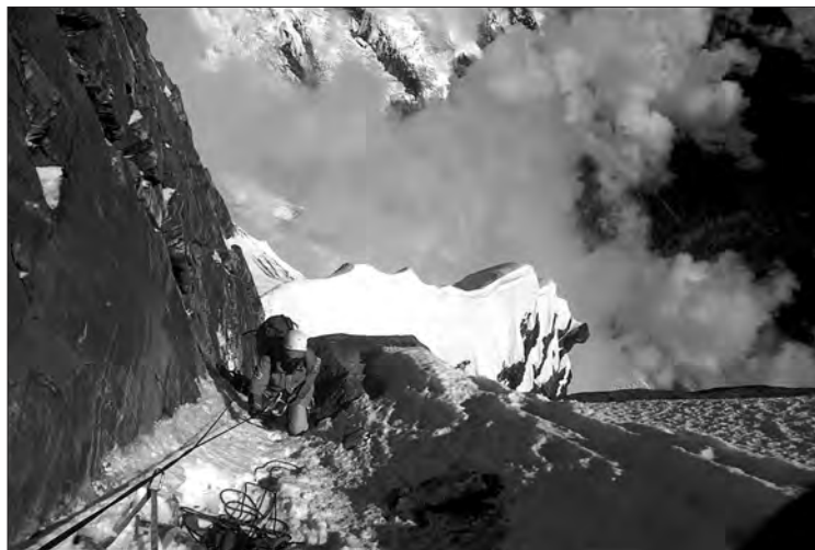
L'Enric en el ressalt de roca que trobem per damunt del quart bivac a 7.500 metres.

De tant en tant, mentre agafo aire, em giro i contemplo la immensitat que m'envolta. La grandesa de l'horitzó es mescla amb la increïble profunditat de l'abisme que tinc per