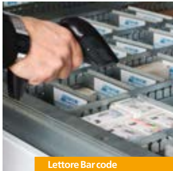
Lettore Bar code