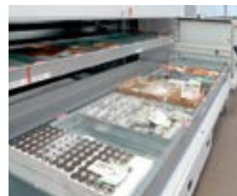
BAIA DOPPIA ESTERNA