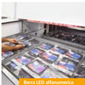
Barra LED alfanumerica