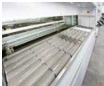
BAIA SINGOLA INTERNA

Il doppio livello di carico è consigliato a chi necessita di un picking veloce e performante poichè incrementa la produttività.