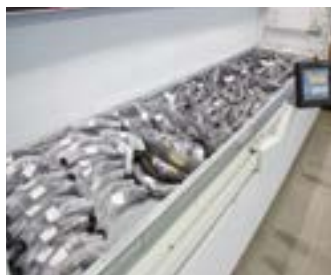
BAIA DOPPIA INTERNA