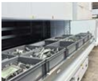
BAIA SINGOLA ESTERNA