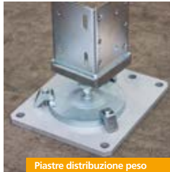
Piastre distribuzione peso