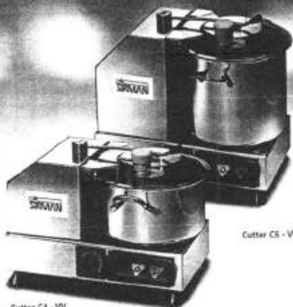
Cutter C4 - VV