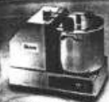
Cutter C9 VV