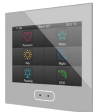
Pantalla táctil ZENIO