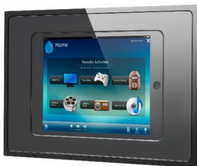
IPAD + fix dock IPAD 10,5

* Sistema Control en todas las dependencias principales con pantalla táctil capacitiva acabado Blanco marca Zenio y teclado multifunción con 8 teclas marca Jung. Permite control de zona de suelo radiante, aire acondicionado, control de screens e iluminación, incluyendo generación de escenas.