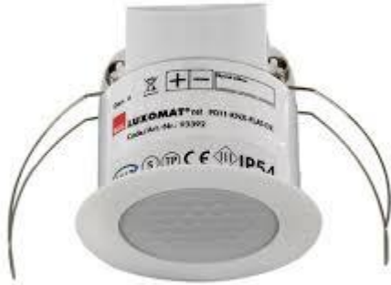
Sensor de presencia KNX