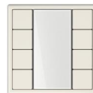
Teclado multifunción JUNG