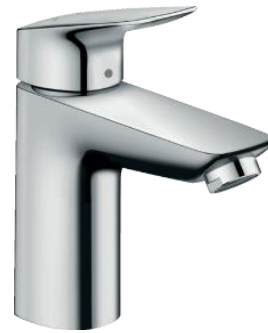
Grifo de bidé mod. Logis