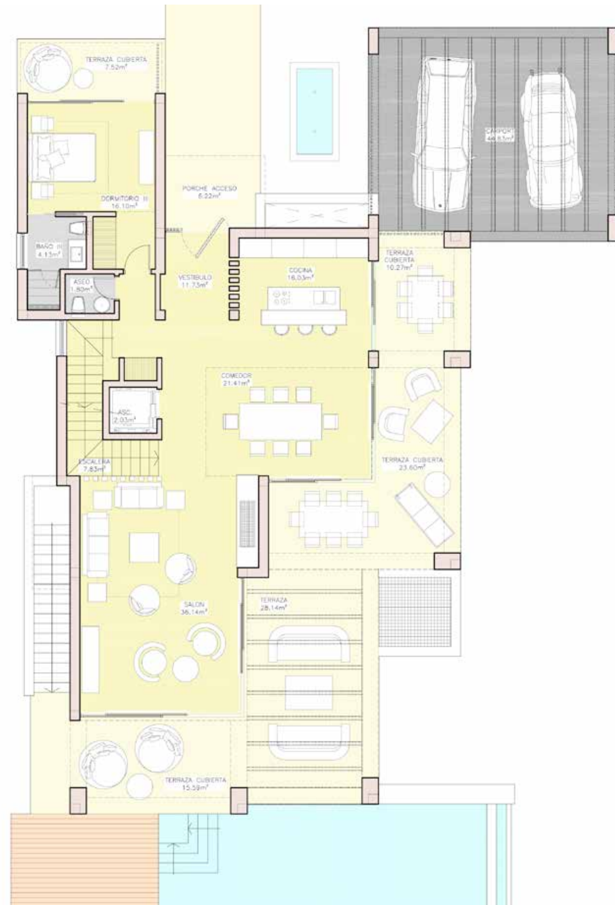
GROUND FLOOR PLANTA BAJA

VILLA 14 4 BEDROOMS / 4 DORMITORIOS 4 BATHROOMS / 4 BAÑOS