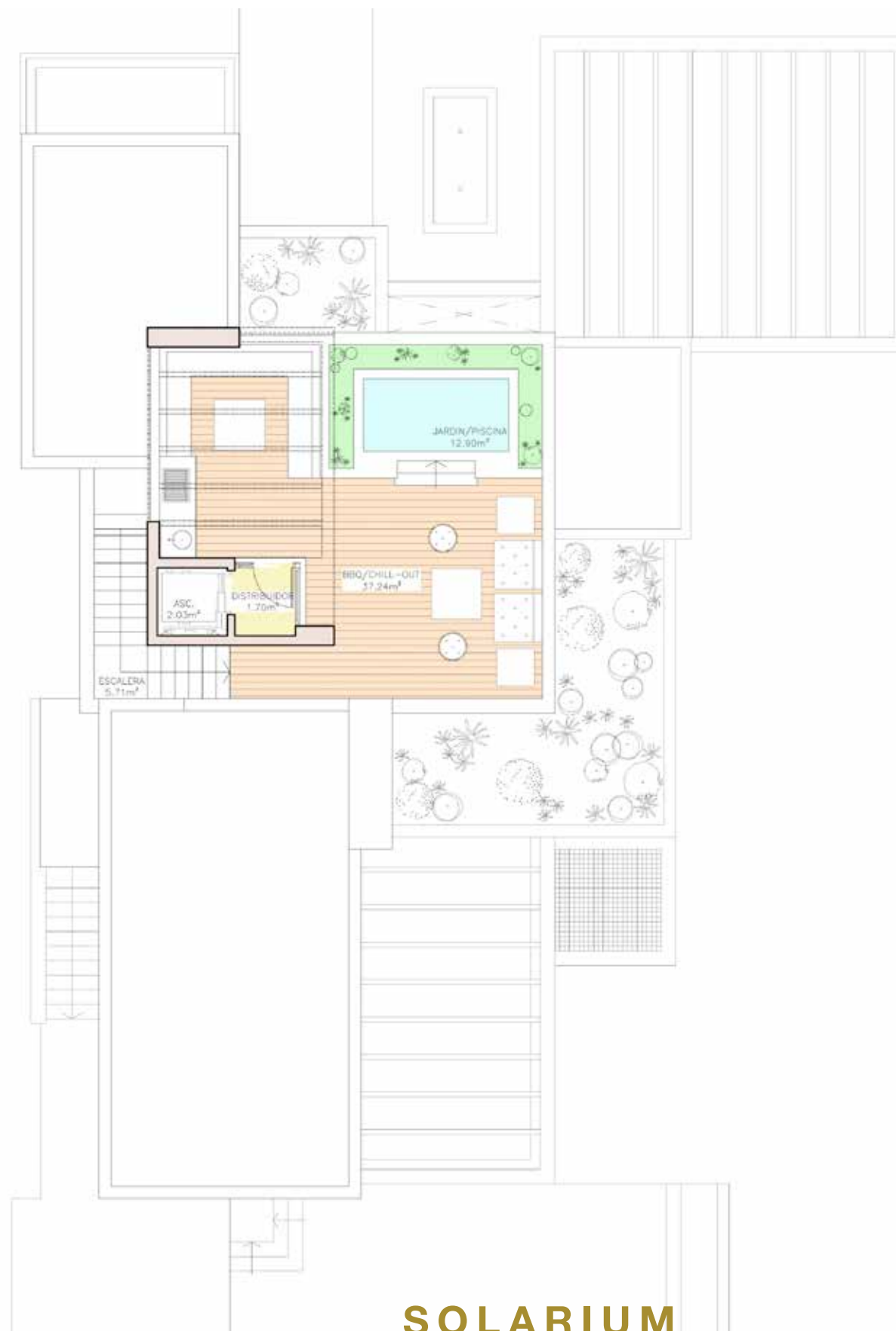
SOLARIUM PLANTA TORREÓN