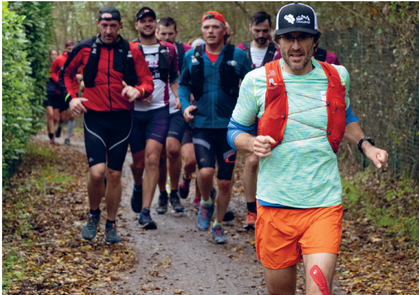
Een bijzondere bedanking aan Yves om de hoogtepunten van de KickCancer Challenge vast te leggen