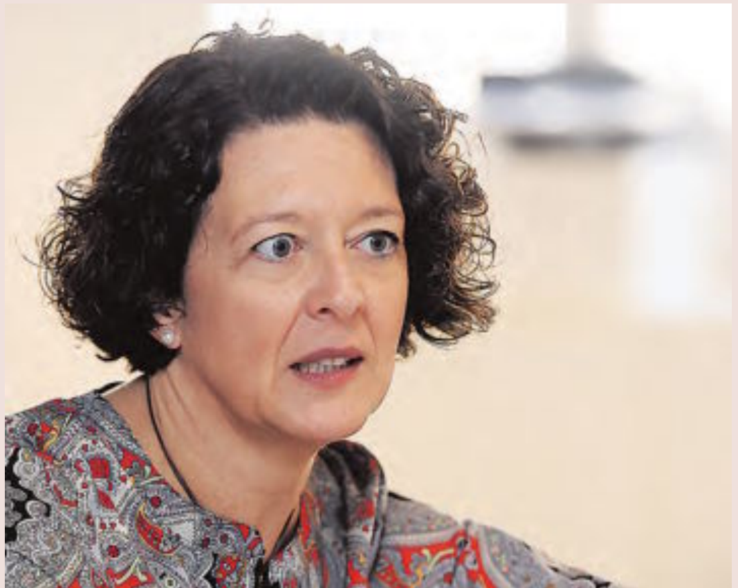
La presidenta de la Sociedad Española de Oncología Médica (SEOM), Ruth Vera, durante su visita a la redacción de GM.

En los últimos tiempos, los oncólogos no han quedado al margen de cuestiones como la sostenibilidad y la equidad, consciente de ello, la sociedad científica ha hecho hincapié en estas cuestiones. Como adelantó Vera, SEOM está trabajando en una actualización de todos sus grupos de trabajo. Uno de ellos es el de acceso a los tratamientos oncológicos, a través de un mapa que analizará las inequidades en toda la geografía española. Los resultados en salud siguen siendo herramientas claves para una especialidad que está en constante transformación. P5, 6, 7 y 24.