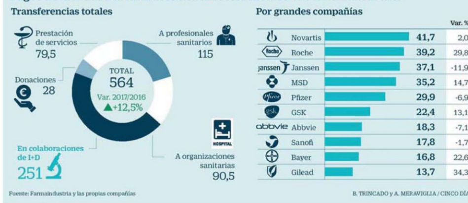
Pagos de la industria farmacéutica al sector médico Año 2017. Millones de euros

El sector contribuyó con 115 millones a ayudas a profesionales para que pudieran acudir a reuniones y congresos científicos, mientras que las organizaciones recibieron 90,5 millones también para este tipo de encuentros. Hay que sumar 79,5 millones por prestación de servicios y, por último, 28 millones en donaciones a asociaciones.