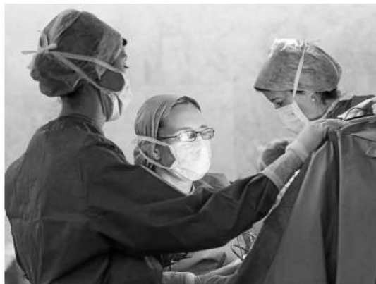
Cirujanas se preparan para una operación en el CHN.