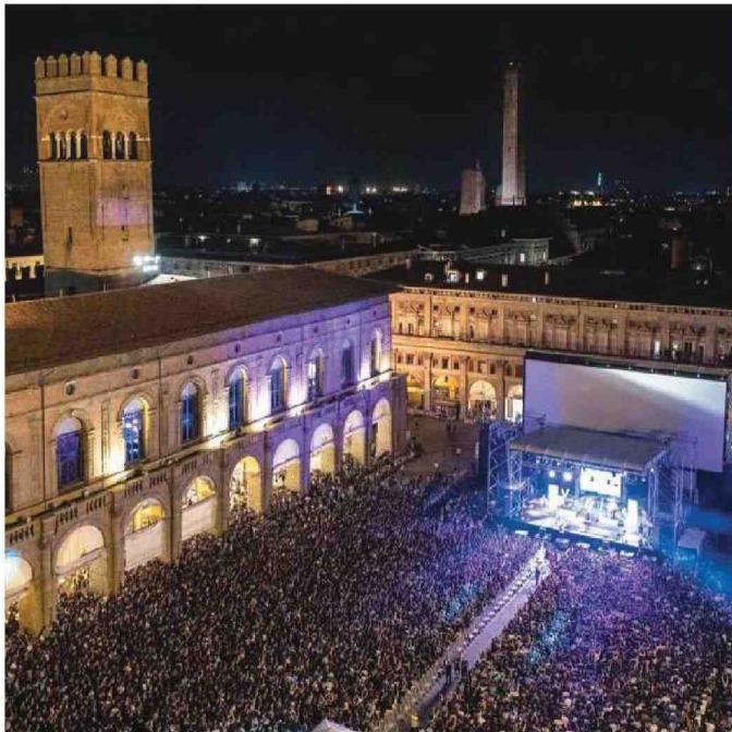
Tra gli appuntamenti clou dell'Estate Bolognese c'è il cinema all'aperto in piazza Maggiore, sopra.