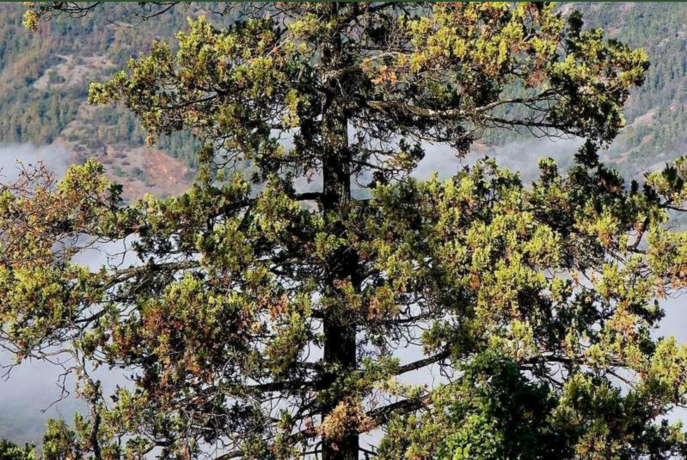
Ciprés de la Cordillera, Austrocedrus chilensis