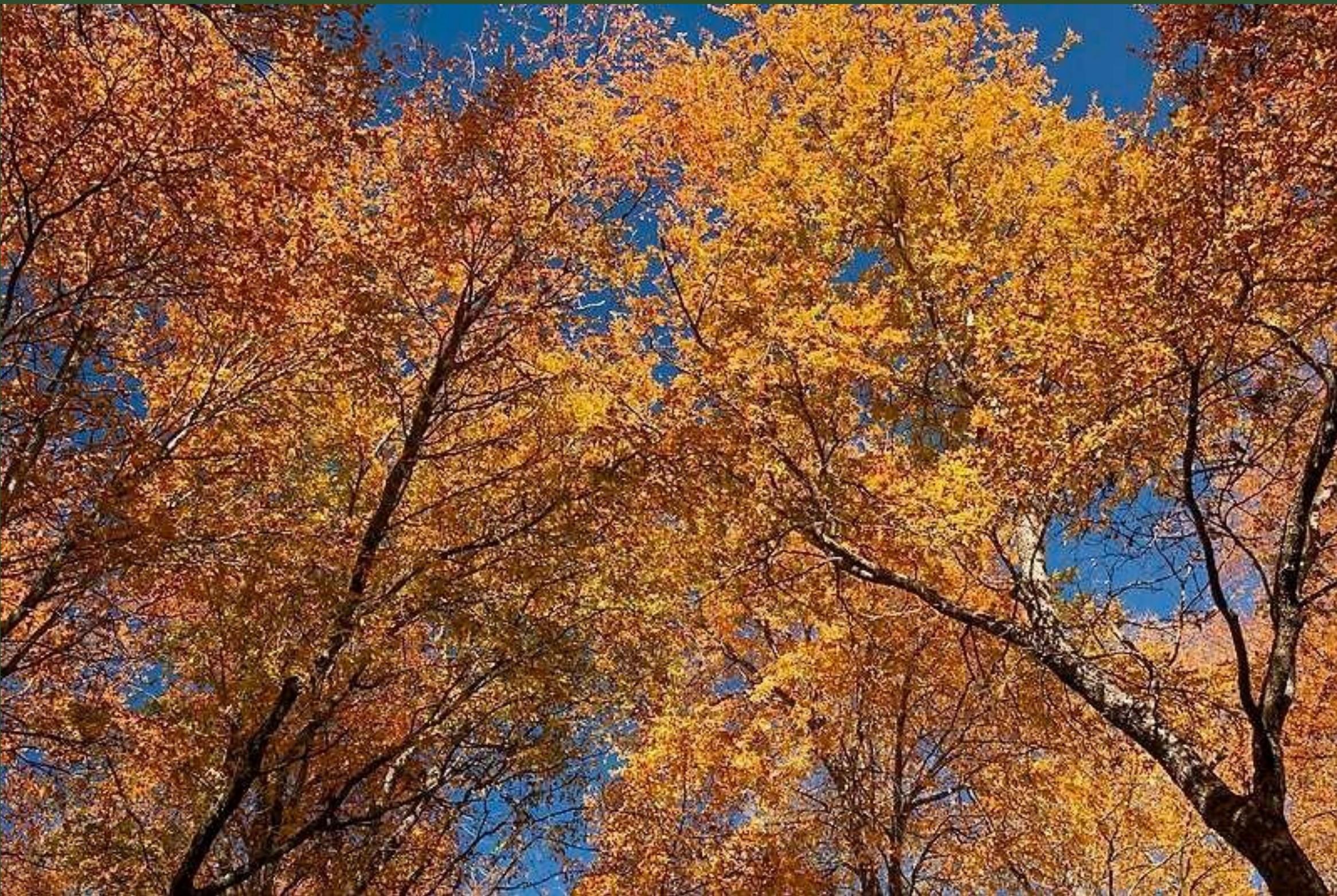
Roble Nothofagus Obliqua