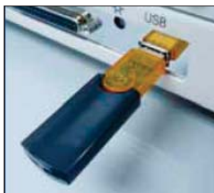
Almacenamiento conectable vía USB. Memoria "flash" no incluida.