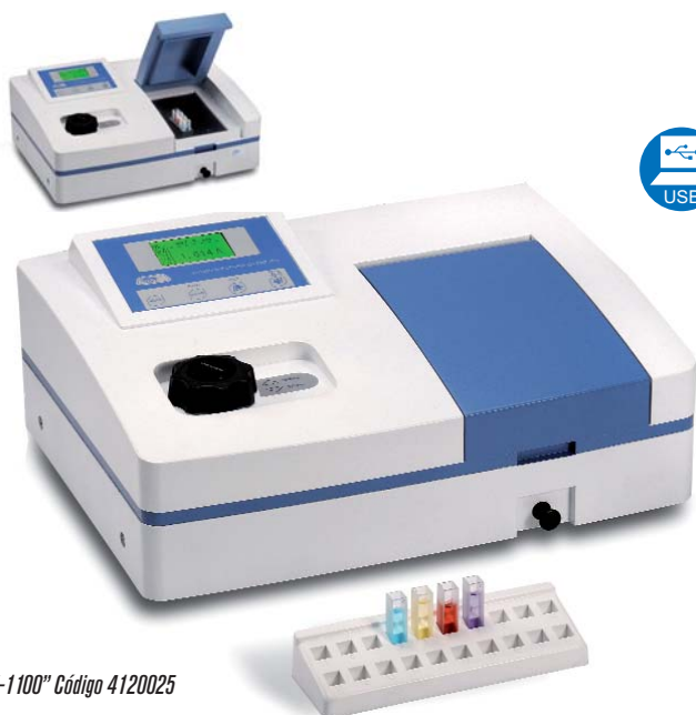
“V-1100” Código 4120025

“VR-2000” MODELO CON SELECCIÓN AUTOMÁTICA DE LA LONGITUD DE ONDA Y BLANCO AUTOMÁTICO.