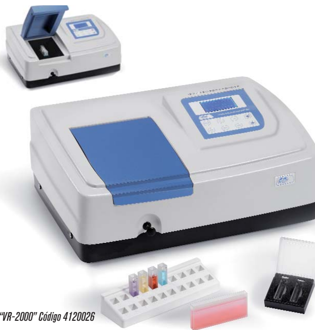
“VR-2000” Código 4120026