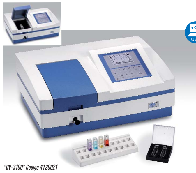
“UV-3100” Código 4120021