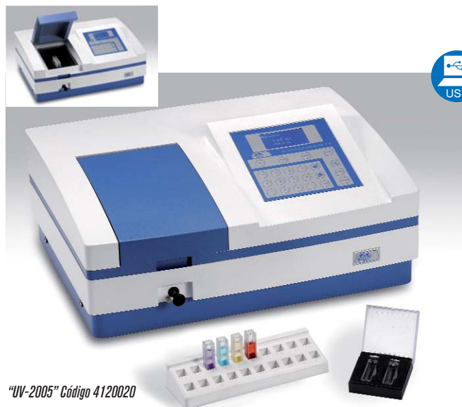
“UV-2005” Código 4120020

MODELOS CON SELECCIÓN AUTOMÁTICA DE LA LONGITUD DE ONDA Y BLANCO AUTOMÁTICO.