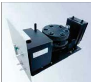
Portacubetas termostatizado de 6 posiciones para cinéticas en cubetas de 10 mm de paso código 5110029