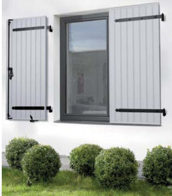
Volets en configuration Contre-pentes en coloris 7035 et ferrage noir.