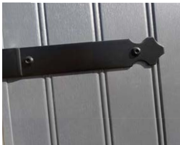
Pentures en aluminium cambrées festonnées noires.