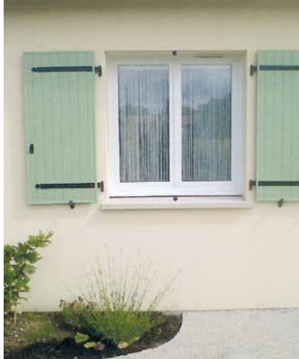
Volets en configuration Contre-pentures en coloris 6021 et ferrage noir.